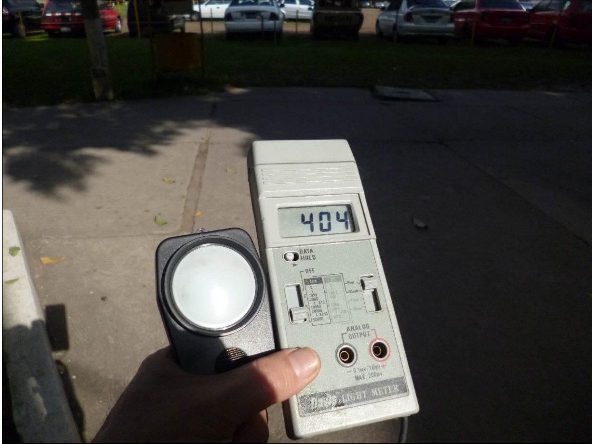
Fig. 4. Lectura de Irradiación solar.