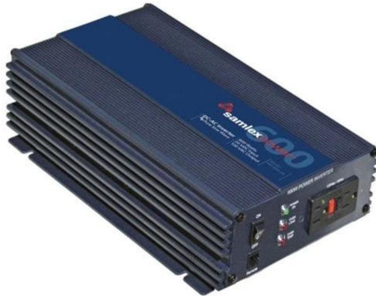
Fig. 5. Inversor 24 VDC a 120 VAC onda senoidal pura Samlex de 600 Watts

Se realizaron las siguientes mediciones en el sistema instalado, en uno de los dos inversores de 600 Watts (marca SAMLEX).