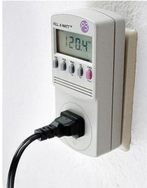
Fig. 6. Vatímetro utilizado en las pruebas.

La figura 6 muestra el modelo de vatímetro utilizado para la medición de potencia real, éste es capaz de medir voltaje, corriente, potencia real consumida, factor de potencia y energía consumida durante un período de tiempo.