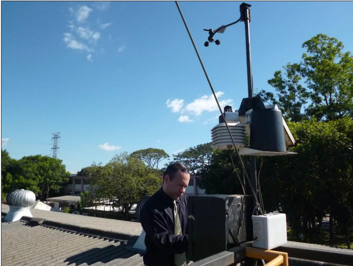
Fig. 1. Estación meteorológica.

La estación meteorológica instalada en el Laboratorio de Energías Renovables permite la medición de la velocidad del viento, temperatura, iluminación, presión barométrica y acumulación pluvial.