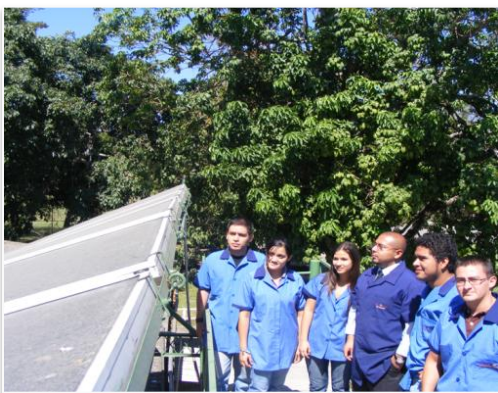
Fotografía No 1: Estudiantes e instructor visitan las instalaciones de colectores fototérmicos en la Sede Central de ITCA – FEPADE

Lo anterior hará posible analizar cómo inciden las variables atmosféricas en la eficiencia de los sistemas fototérmicos instalados en El Salvador.