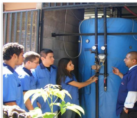
Fotografía No 2: Estudiantes e instructor revisan el sistema automatizado de alimentación de agua