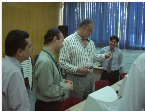
Miembros del equipo participante y experto evaluador del MINED

Con la determinación de complementar dicho proceso, se hace participar a un lector o receptor, definiéndolo como el dispositivo electrónico capaz de recibir, identificar y leer las ondas electromagnéticas emitidas por los tags. Los lectores están compuestos de un circuito electrónico con antenas que permiten captar la presencia de un tag en su limitado alcance, por medio de señal de radiofrecuencias.