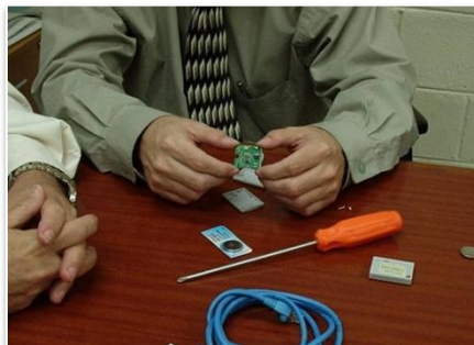
Fotografía 1: Muestras de tag activos

Existen códigos de tipo pasivos, semiactivos y activos. Los activos se diferencian de los dos primeros en tener una fuente de alimentación interna, que permiten emitir ondas electromagnéticas a mayores distancias (Fotografía 1)