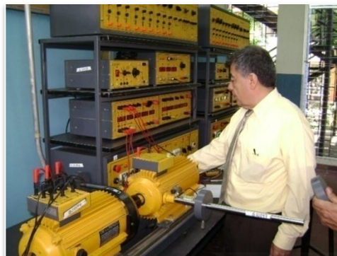
Docente investigador realizando pruebas en banco didáctico para máquinas eléctricas.

Este inconveniente, si bien no inhibía el uso del equipo didáctico para máquinas eléctricas, sí representaba un impedimento para observar las diferentes pruebas en la pantalla de un ordenador; esto es importante porque muchos aspectos de estudio requieren observar el comportamiento de diversas variables en el arranque del motor o en las condiciones de cambio de velocidad, que suelen durar no más de 2 segundos. Sin la PC para monitorear estos cortos períodos de tiempo resulta prácticamente imposible observar los cambios en las magnitudes que se desea monitorear.