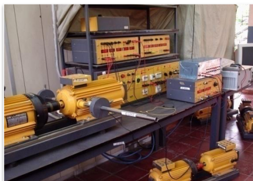
Motor y freno con equipo didáctico para máquinas eléctricas

Con el pasar del tiempo y el avance tecnológico de las computadoras, éstas dejaron de tener el puerto ISA.