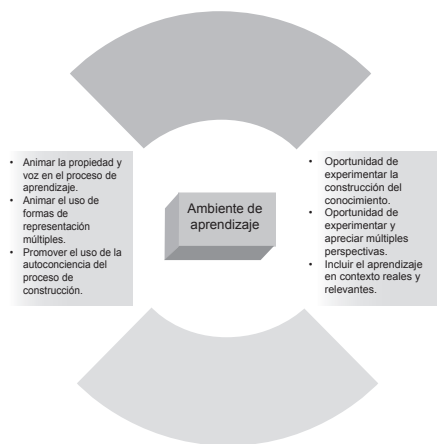
Gráfico Ambiente del Aprendizaje

Un elemento de vital importancia en el desarrollo de las estrategias de aprendizaje lo constituye el ambiente que de acuerdo con Honebein (1996) debe considerar, los elementos insertos en el gráfico.