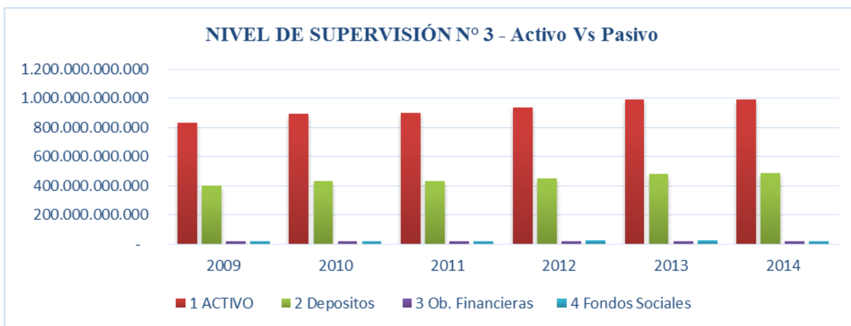
Gráfico 6.