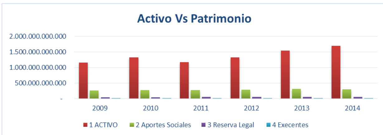
Gráfico 5.

Los aportes sociales de las entidades del nivel 2, equivalen al 26 por ciento del total de los activos del grupo para 2014 (cuadro 10), cifra superior a la del nivel 1 que corresponde al 15 por ciento. Los resultados son desfavorable para estos fondos debido a que su traslado al