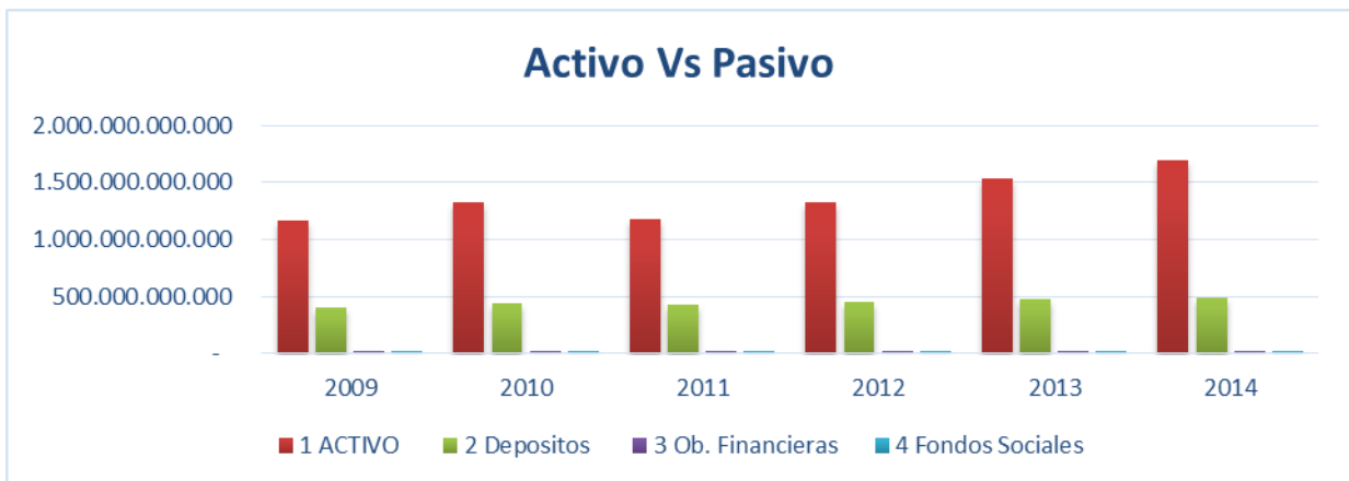
Gráfico 4.