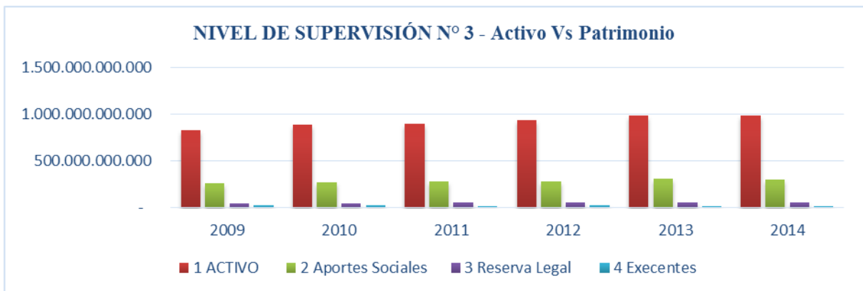
Gráfico 7.

El patrimonio (cuadro 16) conformado en su mayoría por los aportes sociales de los asociados, equivale a un 31 por ciento para 2014. Esto no favorece en nada a estas entidades si se tiene en cuenta que la reclasificación de estos recursos como pasivo las deja prácticamente