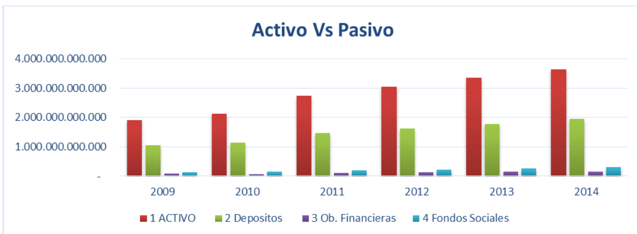
Gráfico 2.