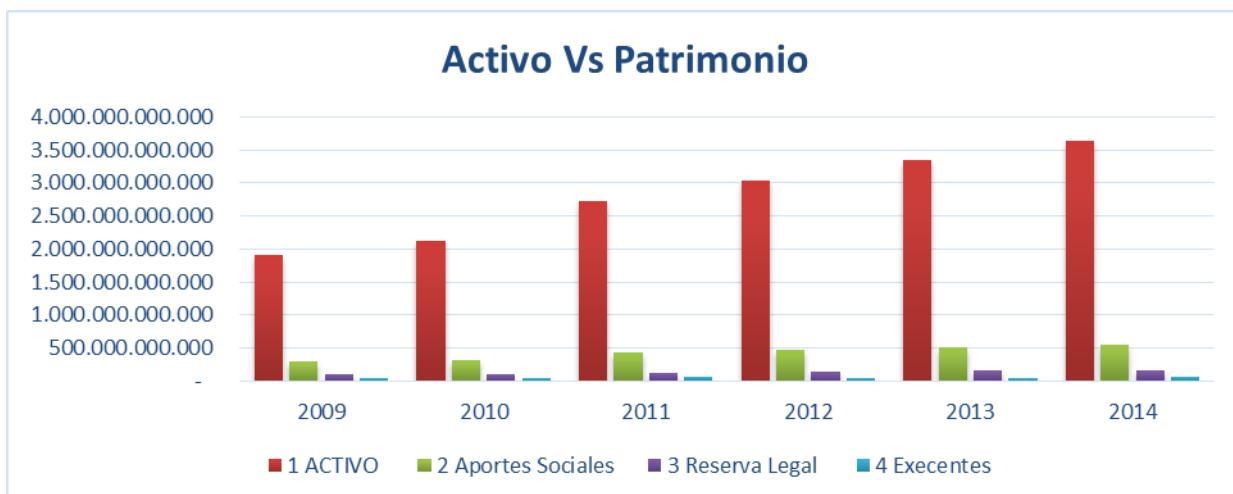
Gráfico 3.

Como se mencionó antes, el patrimonio de los fondos de empleados está compuesto por los aportes sociales, que constituyen su capital social y provienen del 10 por ciento del total de la cuota periódica que ahorran los asociados. Estos recursos deben devolverse cuando el asociado se retira, por lo tanto, si bien hacen parte del patrimonio de la entidad, no son recursos estables debido a que se disminuyen en la medida en que hay retiro de asociados. Por tratarse de recursos que deben devolverse, aquí se presenta el gran impacto de la aplicación de la NIC 32 de las NIIF, la cual precisa que recursos de esta naturaleza deben clasificarse como pasivos, que son parte del patrimonio aquellos recursos que tienen la prohibición de devolverse cuando un asociado se retira.