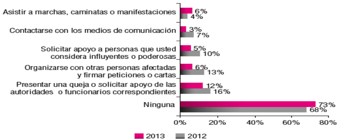
Ilustración 3. ENCUESTA DE PERCEPCIÓN CIUDADANA, MEDELLÍN CÓMO VAMOS 2013. Acciones realizadas para resolver un problema de grupo.