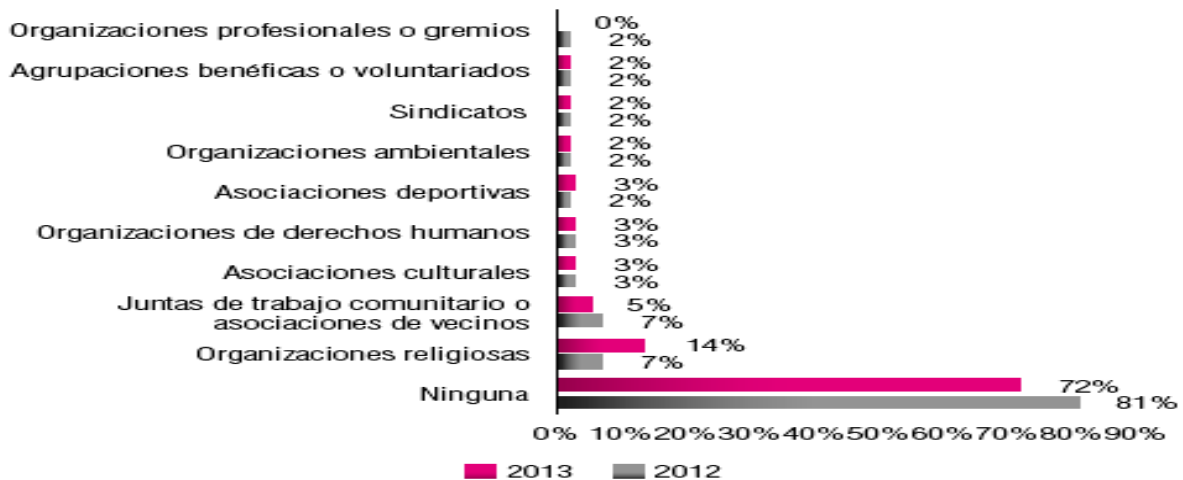
Ilustración 4. ENCUESTA DE PERCEPCIÓN CIUDADANA, MEDELLÍN CÓMO VAMOS 2013. Participación en organizaciones y/o grupos 5