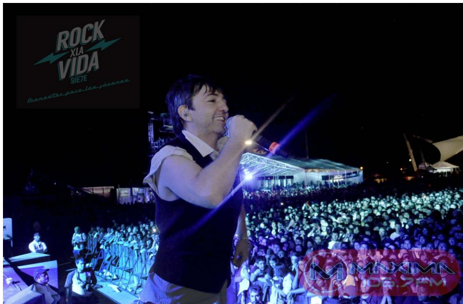
Babasonicos, RXLV 7, 2014