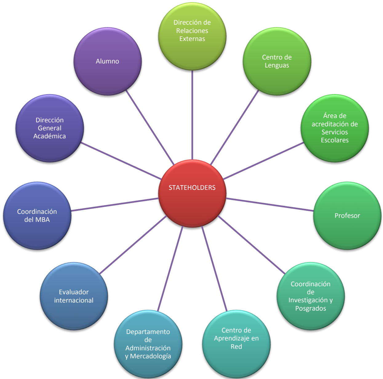
Gráfico 2. Stakeholders de la investigación para la acreditación de la Maestría en Administración. Stakeholders