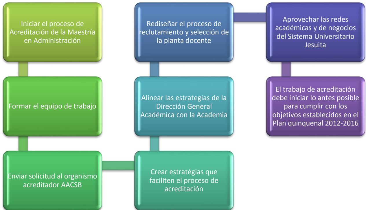
Gráfico 3: Modelo propuesto del proceso de acreditación para la Maestría en Administración.