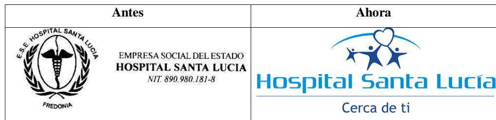
Ilustración 2. El antes y el ahora del logotipo del Hospital Santa Lucía

En la ilustración 2 se presenta el cambio del logotipo del hospital acompañado de su eslogan “cerca de ti”.