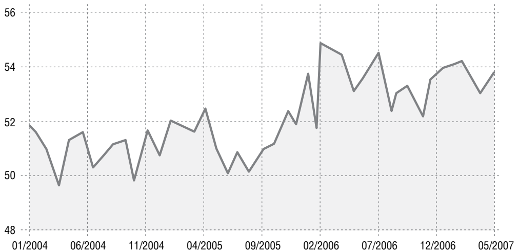
■ Gráfica 2 Índice de confianza del productor (puntos)