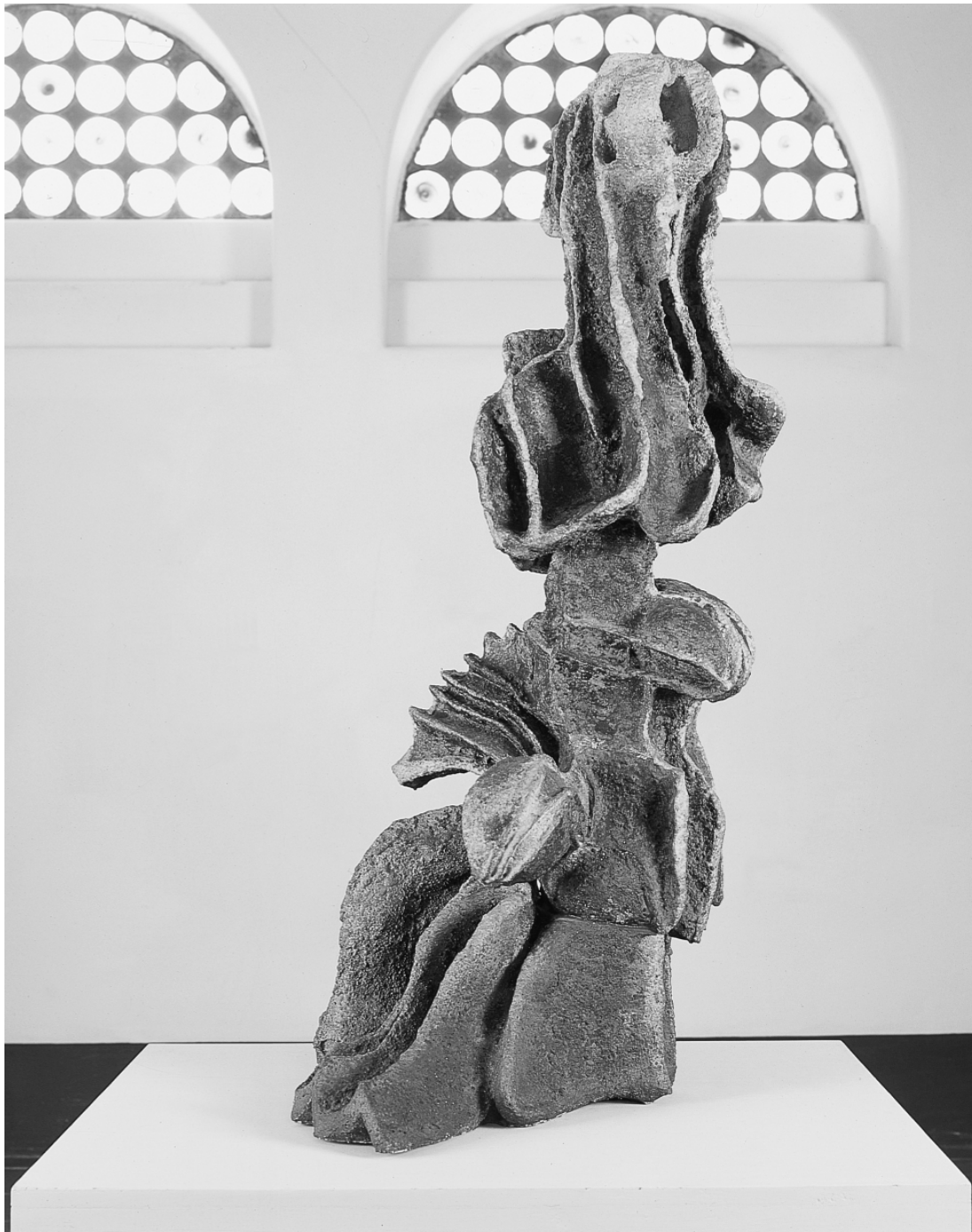
Mujer frente al mar ; cerámica, 117 x 50 x 51.5 cm, 1966, colección Museo de Arte Moderno.

Gaceta 6 de diciembre , IV informe anual, núm. extraordinario, Guadalajara, febrero de 2001, p.81.