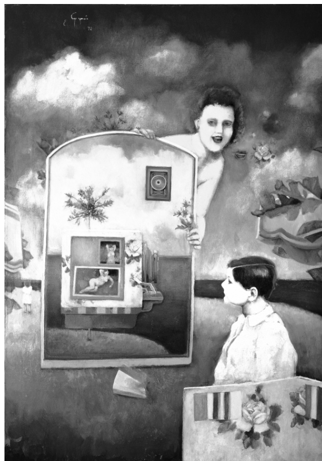
Homenaje a la fotografía , óleo sobre tela, 112.5 x 79.9 cm, 1972, colección Museo de Arte Moderno, INBA.

El diagnóstico que hacía Rubín de las condiciones del lago en los años cincuenta se fue afinando