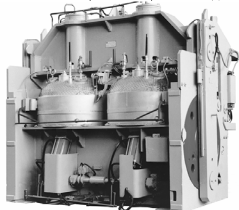
Двомісний форматор-вулканізатор автомобільних шин