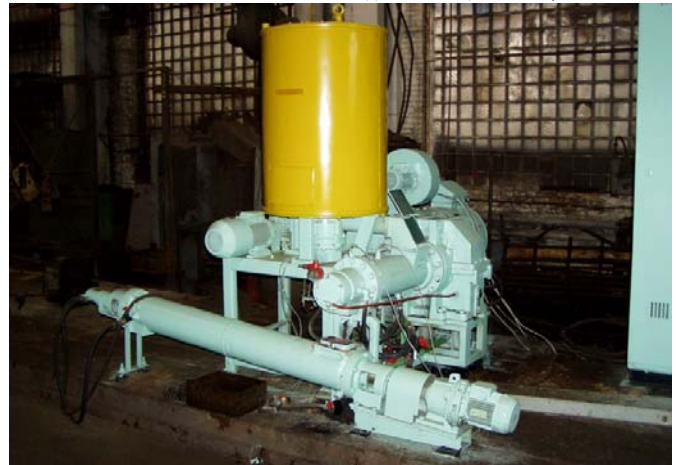
Диспергатор-екструдер черв'ячно-роторний ДЕКЧЕР-150 на складальній дільниці механоскладального цеху № 3 ПАТ «НВП „Більшовик”» (фото автора статті)