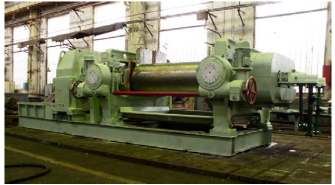
Змішувально-підігрівальні вальці для пластмас ВП-См-Пд 2100(660/660) з потужністю приводного двигуна 200 кВт на складальній дільниці механоскладального цеху № 1 ПАТ «НВП „Більшовик”»

Основний напрям наукових інтересів Ю. Ю. Лукача – неізотермічні процеси та обладнання перероблення матеріалів з використанням високомолекулярних сполук, а також наукові засади