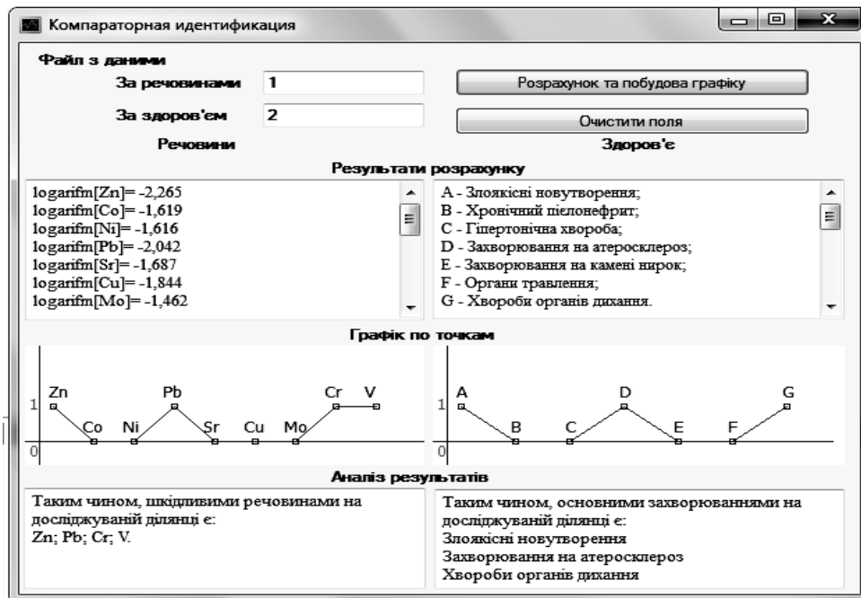
Рис. 3. Приклад оцінки рівня екологічності території