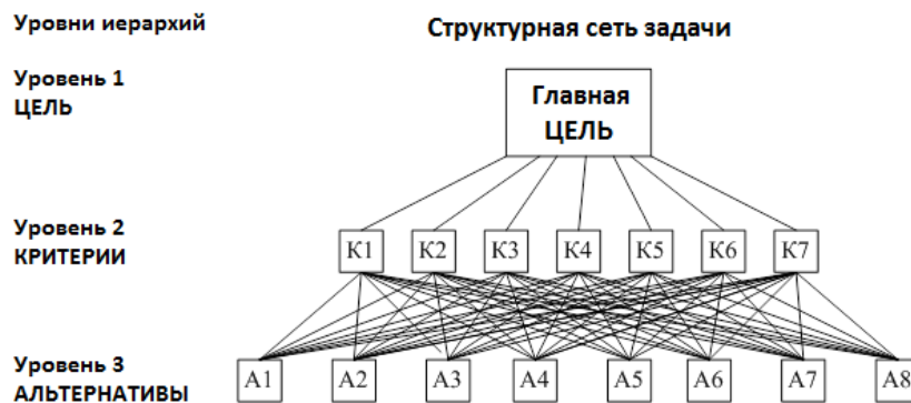
Рис. 1 Схематический вид доминантной иерархии

В нашем случае имеем полную доминантную иерархию