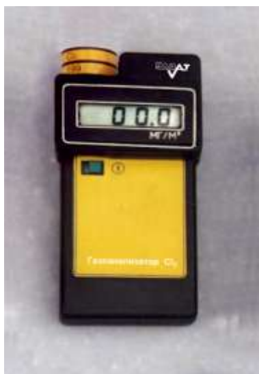
Рисунок 2 – Зовнішній вигляд портативного газоаналізатору 662 ЕХ02

Описані прилади базуються на використанні електрохімічного методу аналізу. Слід сказати, що особливістю електрохімічних датчиків є їх низька інструментальна точність при високій селективності, отже їх зручно застосовувати для вимірювання концентрації токсичних речовин, таких як хлор. Крім того електрохімічні датчики відрізняються від інших ще й високою економічністю (не потребують підігрівання) і можливістю працювати у вибухонебезпечних сумішах. На рис. 2 приведено зовнішній вигляд портативного газоаналізатору 662ЕХ02.