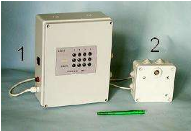
1 – блок сигналізації і живлення; 2 – вимірювальний перетворювач

На рис. 1 зображено зовнішній вигляд сигналізатору СМК, а на рис. 2 наведено структурну схему сигналізатора. Сигналізатор складається з чотирьох вимірювальних перетворювачів ВП-1...ВП-4 та блоку сигналізації і живлення БС. Сигналізатори серії СМК мають наступні модифікації: СМК-4 для вимірювання метану з термокatalітичними датчиками та СМК-21 для вимірювання оксиду вуглецю з напівпровідниковими або електрохімічними датчиками.