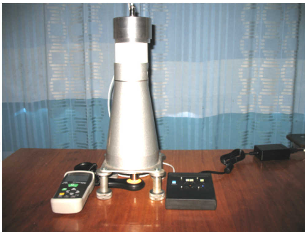
Рис. 2. Лабораторна установка для вимірювання освітленості операційної площини СВиФТ-90

V_{\lambda} = 683 лм/Вт - світловий еквівалент випромінювання.