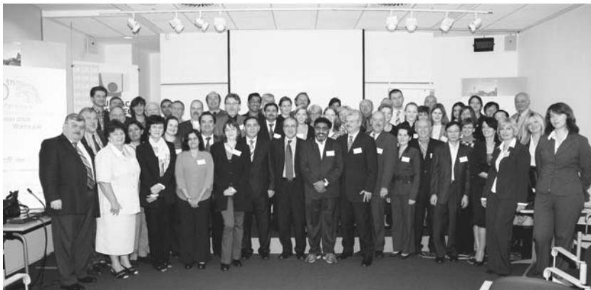
Учасники 40-ї конференції МК у Варшаві

Президент МК, доктор, професор Вольфганг Файгле представив перше число журналу ІС МК, а також інформацію про тематику, склад редколегії та вигоди щодо оформлення статей.