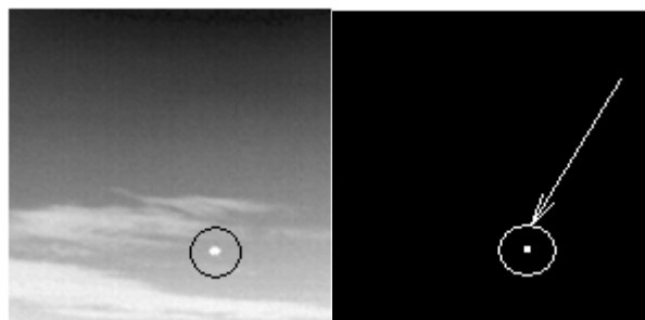
Рис. 4. Ілюстрація дії методу при збільшенні розміру цілі

Доцільним є використання даного алгоритму в системах з можливістю обробки великих масивів чисел (за наявності потужного процесора), в яких пи-