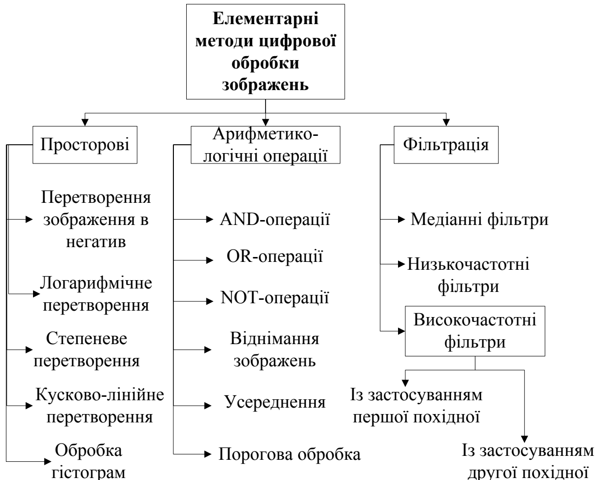
Рис. 1. Елементарні методи цифрової обробки зображень

Основні просторові методи цифрової обробки зображень, на поєднанні яких базуються більшість відомих алгоритмів у конкретних приладах, представлені на рис. 1. Ці методи головним чином є проблемно-орієнтованими.