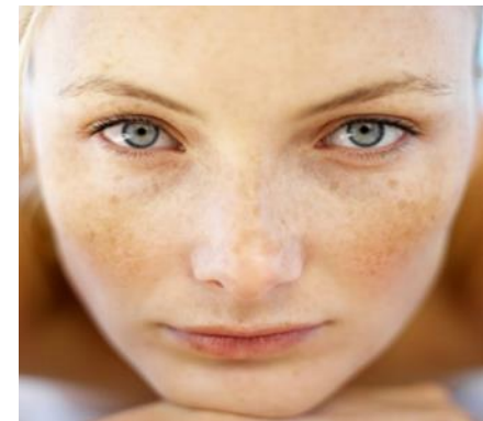
Fig. 2 - cloasma

Cloasma - aumento da pigmentação mediada ao nível hormonal à volta dos olhos e da face