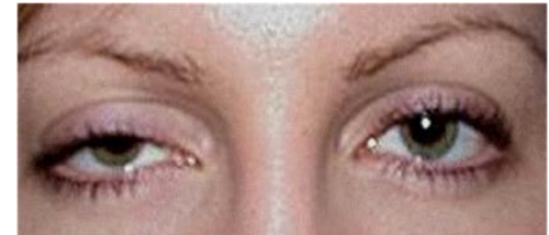
Fig. 1 – Ptose palpebral OD

Ptose - muitas vezes unilateral, pode ocorrer durante ou após a gravidez, como resultado de modificações hormonais ou alterações relacionadas com o stress no trabalho de parto