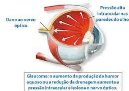
Fig. 3 - Consequências do aumento da PIO