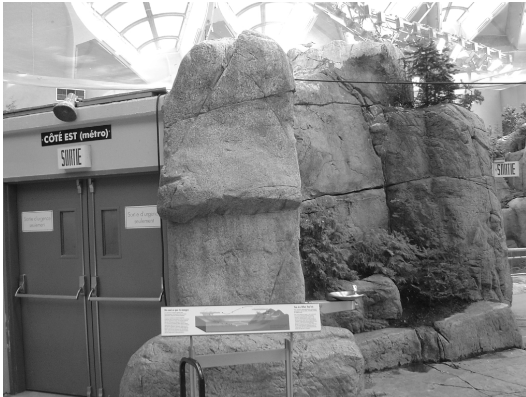
Figure 5 : Dans le Saint-Laurent marin, un espace hybride, 22/03/04

A hybrid space: the Saint-Lawrence seaway