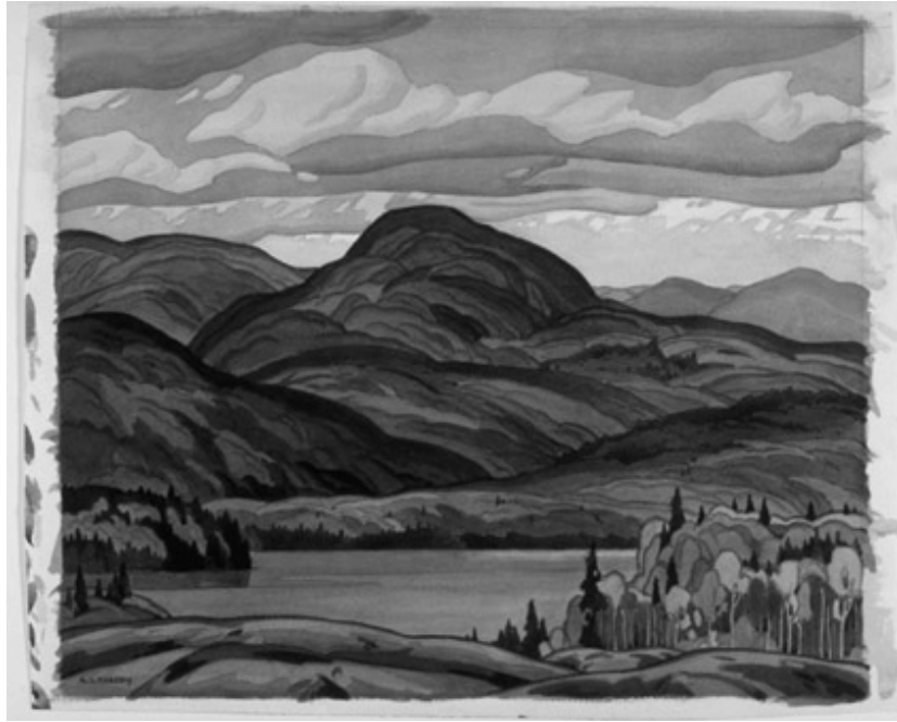
Figure 7 : Casson A. J., 1929, Pike Lake, McMichael Canadian Art Collection

Il faut voir que les travaux du groupe des sept a rencontré un succès notable parmi la nouvelle élite canadienne en formation mais également dans les couches populaires grâce aux nombreuses gravures qui étaient tirées à partir des originaux. Cette représentation du paysage canadien, loin d'être un modèle dépassé, est encore largement réactualisée aujourd'hui, notamment au travers des publicités diffusées dans le Canadian Geographic .