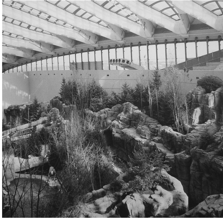
Figure 4 : La forêt laurentienne en préparation, 1992