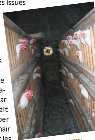
Finition des volailles de Bresse en épinettes. Saint-Denis-les-Bourg, Ain, 2005.

En Bresse, la querelle des anciens et des modernes concernant l'introduction du soja dans l'élevage des volailles a duré des années. Cette pratique remettant en question le système d'alimentation traditionnel – carencé en protéines – était encouragée par les abatteurs et certains éleveurs. Elle permettait d'abaisser les coûts de production et de développer l'élevage pour les uns ; elle modifiait le persillé de la chair et portait atteinte à la notoriété de l'appellation pour les autres. Les tensions restèrent vives pendant plusieurs années, jusqu'à ce que les décisions aient été prises une bonne fois pour toutes et consignées dans le règlement intérieur de l'appellation.