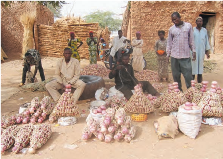
Une production localisée de grande importance au Niger : l'oignon de Galmi. Niger, 2006.

A ce jour, le parmesan est une marque déposée aux Etats-Unis et les producteurs italiens de cette AOP n'ont pas le droit d'y vendre leur produit sous ce nom... Pourtant, indications géographiques et marques ne sont