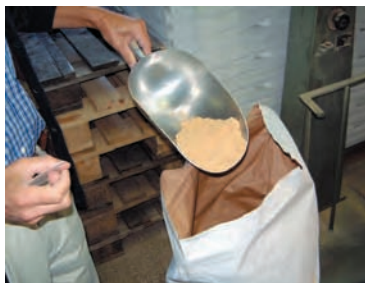
Les gaudes, bouillie préparée à partir de farine de maïs grillé, ont longtemps constitué l'aliment de base des Bressans. Moulin Taron, Chaussin, Jura, 2003.