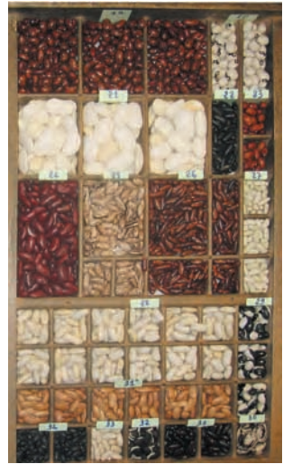
Le haricot et sa grande diversité variétale. Collection de Gérard Brossette, Genay, Rhône, 2006.

Par ailleurs, les semences et plants des variétés inscrites sont soumis à un contrôle du Service officiel de contrôle et de certification (SOC), visant à assurer la conformité variétale, l'homogénéité, la faculté germinative et l'état sanitaire des lots commercialisés.