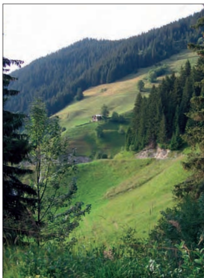
La puissance évocatrice de la montagne... Alpages vers le col du Pré, Boudin, Arêches, Savoie, 2005.

Beaucoup de producteurs montagnards engagés dans des demandes de protection considèrent que cette mention ne fait que brouiller un peu plus les cartes. Là encore, l'outil est ce qu'en font les hommes. Dans certains cas, cette démarche de valorisation s'inscrit clairement dans une logique d'aménagement du territoire ; dans d'autres, elle tire parti d'une image à moindre frais.