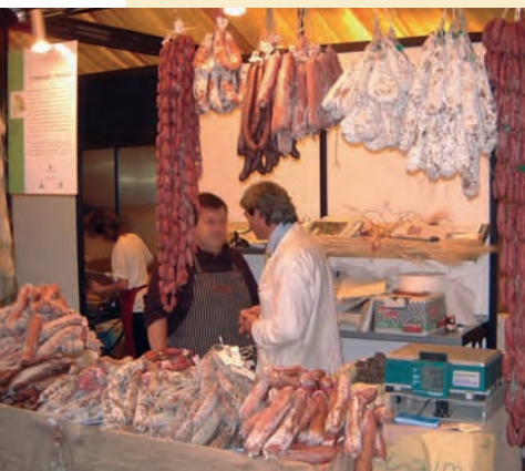
Le « Salone del gusto », rendez-vous international des producteurs et des consommateurs de produits locaux. Turin, 2002.

petits producteurs du monde entier tous les deux ans à Turin. Vitrine de toutes les activités de l'association, elle montre de façon convaincante la richesse et la diversité des cultures gastronomiques locales. Les organisateurs choisirent ce cadre pour lancer l'opération « L'Arche du goût » qui vise à recenser, faire connaître et réinsérer dans le circuit commercial les productions locales ignorées ou en risque d'extinction. Enfin, depuis 2003 l'« Université des Sciences gastronomiques » coordonne les savoirs multiples et les activités nombreuses ayant trait à l'alimentation en choisissant comme fil directeur la gastronomie. Présent dans 80 pays, le mouvement compte en France 1500 membres, qui se répartissent dans une vingtaine de groupes locaux, appelés « conviviums ». Le salon « Aux origines du goût » se tient à Montpellier depuis 2003 ; organisé selon un schéma inspiré du « Salone del gusto », il a lieu tous les deux ans en alternance avec ce dernier.