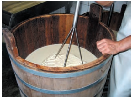
Le salers, fromage fermier AOC, se fabrique d'avril à novembre. Le caillage a lieu dans une gerle en bois. Région d'Aurillac, Cantal, 2006.

La transmission – ici dans le cadre de l'apprentissage – peut s'effectuer par l'intermédiaire d'acteurs occupant une place spécifique dans la société locale ou dans la famille. La transmission peut être relayée par d'autres maillons, en fonction de la recomposition des sociétés rurales, en particulier dans les milieux les plus difficiles qui souffrent souvent de désertification et sont plus perméables