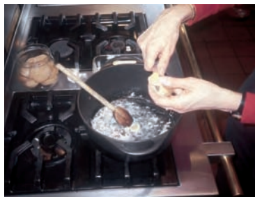
Le ramequin du Bugey, originaire de la région de Saint-Rambert-en-Bugey, Ain, se consomme à la façon d'une fondue.