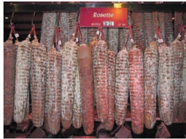
Rosette et saucisson de Lyon se ressemblent ; et pourtant ce sont deux charcuteries fort différentes. Halles de Lyon, 2005.