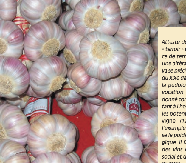
L'ail de Lautrec, présenté en « manouilles », Indication géographique protégée depuis 1996.

humains (techniques, usages collectifs...), une production agricole et un milieu physique (territoire). Le terroir est valorisé par un produit auquel il confère une originalité (typicité) » (3).