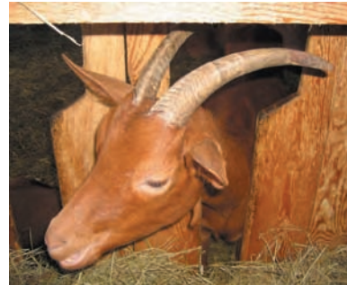
Nombreux sont les fromages au lait de chèvre dans les Alpes du Nord. Le grataron d'Arèches, un proche cousin du chevrotin.

C'est incontestablement dans les Aravis que la production de chevrotin est la plus structurée. Les éleveurs installés dans ce massif sont d'ailleurs à l'origine de la demande d'AOC – obtenue en 2002 – basée au départ sur le chevrotin « des Aravis ». Ceux des autres massifs manifestèrent leur désir de rejoindre le projet, mais sous quelle dénomination ? En effet, au-delà des Aravis, l'antériorité de la fabrication et