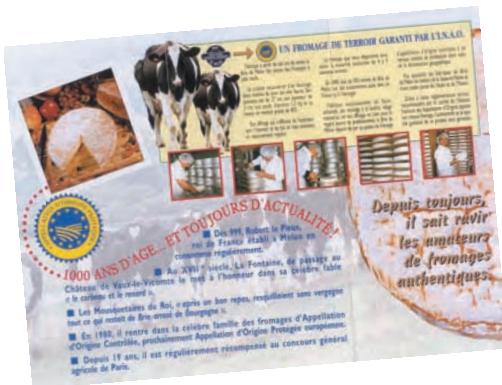
Un brie hors d'âge...

hasard, l'erreur, la légende et des personnages célèbres de toute espèce. L'origine est souvent « ancestrale », date de la « nuit des temps » ou renvoie à la légende, volontiers imprégnée de hasard. Le roquefort vit le jour grâce à un berger ayant précipitamment quitté la grotte où il se trouvait en laissant un quignon de pain et un morceau de fromage. Quelque temps plus tard, il retrouva un fromage devenu bleu et goûteux, raconte l'histoire.