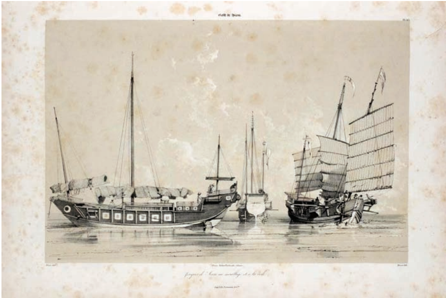
Illustration 2 : Jonques de Siam au mouillage

recherchées). » 70 À la fois livre savant et livre de prestige comme la plupart des atlas accompagnant les relations de voyage, l' Essai présente cette particularité d'une austérité du texte contrastant avec un grand souci de l'esthétique dans la réalisation des gravures. Pâris s'entend en artiste avec l'éditeur et exige pour les plans une grande précision, pour les vues en situation un réalisme qui permette de rendre les impressions des ciels et des mers, ce qui justifie le choix du papier, de la technique de gravure et des artistes 71 . Tout en conciliant technique et esthétique il fait de l'image un véritable instrument de savoir, ouvrant la voie à l'émergence d'une science nouvelle 72 , entre ethnographie et naturalisme 73 de l'objet naviguant.