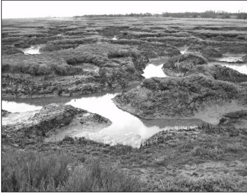
Photo 1 : la forte érosion du schorre de Tollesbury (Blackwater estuary, Essex) a justifié une dépoldérisation défensive (mars 2008).

avaient, en 1999, une durée de vie inférieure à dix ans (Rupp-Armstrong & Nicholls, 2007)! D'après des études prospectives, les dégâts associés aux tempêtes et aux submersions pourraient être deux à trois fois plus élevés qu'actuellement et l'investissement nécessaire au renforcement et au maintien des structures défensives, en Angleterre et au Pays-de-Galles, pourrait atteindre en moyenne 50 millions de livres par an (Department of Environment, Transport and Regions, 2000). Le choix de réaligner les digues plutôt que de les renforcer s'impose donc naturellement.