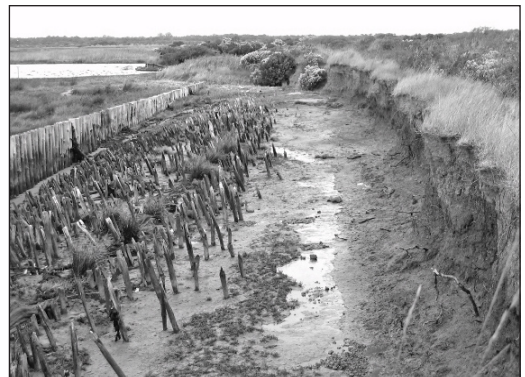
Photo 2 : forte érosion de la digue frontale de Malprat, dans le bassin d'Arcachon (sept. 2008). On reconnaît les anciens piquets de fondation de la digue. Son recul actuel est clairement matérialisé par des piquets plus récents (à gauche des premiers), qui devaient aider pendant un temps à son renforcement. Le CEL a conservé les brèches qui se sont produites, acceptant cette dépoldérisation accidentelle pour réduire entre autres les coûts d'entretien des digues.

cet organisme à rendre ces sites sensibles à la mer – ce qu'il a d'ailleurs déjà réalisé à plusieurs reprises, en laissant ouvertes des brèches qui s'étaient accidentellement produites. Il est vrai que la philosophie du Conservatoire est celle d'une absence de résistance à la mer, de façon à conserver les aspects naturels des sites et leurs équilibres écologiques. Ainsi, si l'objectif du Conservatoire n'est pas prioritairement défensif, comme dans le cas du managed realignment , il peut toutefois l'être indirectement, puisqu'il peut souhaiter – en acceptant des dépoldérisations accidentelles ou en dépoldérant volontairement – réduire le coût d'entretien de digues défectueuses, tout en contribuant à une restauration écologique (cf. photo 2).