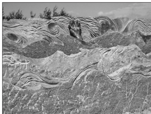
Photo 3 : monument commémoratif de la tempête de février 1953 en Zélande. La faiblesse de l'homme face aux flots marins est clairement exprimée.

Dans ce contexte, on comprend que les Zélandais réproouvent l'idée de dépoldérisation : les polders ont été difficilement conquis ; ils font la fierté du pays ; les rendre à la mer serait un « gâchis ». Cette fierté nationale est inculquée dès l'école primaire et même les écologistes s'y disent sensibles (V. Klap, ZMF, comm. pers.). Pour les personnes plus âgées qui ont vécu la tempête de 1953, l'émotion entre aussi en considération dans ce refus, car les plaies sont restées vives. Les Zélandais frappés personnellement en 1953 ou concernés