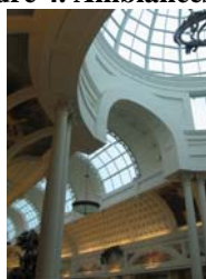
Figure 4. Ambiances architecturales à l'intérieur de Canal Walk (Century City)

Cette volonté de copier la ville, de faire émerger un morceau de ville qui serait de plus en plus autonome, où la population pourrait ne vivre que là, sans aucun autre besoin d'aller ailleurs, trouvant là tous les avantages de la ville sans les contraintes de pollution, de congestion mais surtout de sécurité, n'est pas sans dégager un sentiment relativement d'effroi sur le devenir de l'urbain. En effet, on frôle ici les frontières de La ville qui n'existait pas (Bilal, Christin, 1977), où à côté de la ville industrielle en crise, émerge sous une bulle une ville sans contrainte, dédiée à la consommation et au plaisir. La question du modèle de la ville de demain demeure majeure.