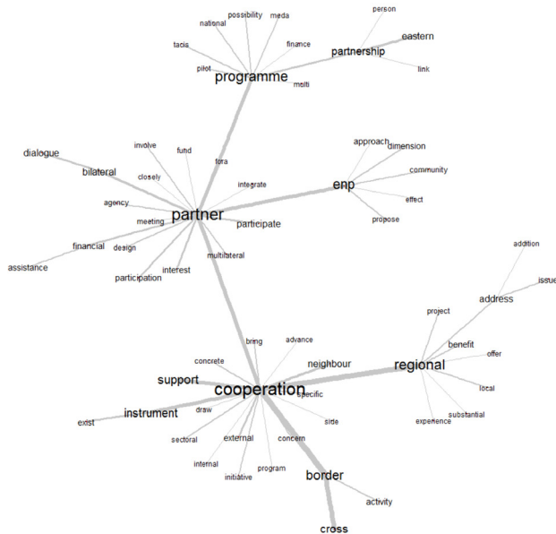
Figure 1. Univers lexical associés aux modalités de fonctionnement de la PEV

Le vocabulaire utilisé pour mettre en mots la politique de voisinage à intervalles de temps réguliers met en évidence des univers lexicaux qui se dessinent autour de notions-clés. L'analyse des communications-cadres de 2003 à 2013 révèle une grande diversité des mondes lexicaux en lien avec la désignation des entités spatiales. Plusieurs méthodes peuvent être utilisées pour étudier ces univers : fixer un objet spatial (région, nation) et interpréter son contexte d'utilisation, ou partir d'un des univers lexicaux qui émergent du corpus 3 et interpréter les proximités autour de notions qui paraissent pertinentes. Les graphes de similitude (figures 1 et 2) illustrent la configuration de deux mondes lexicaux associés, l'un autour des modalités de fonctionnement et d'action de la PEV (figure 1), l'autre autour des pays éligibles à la PEV (figure 2).