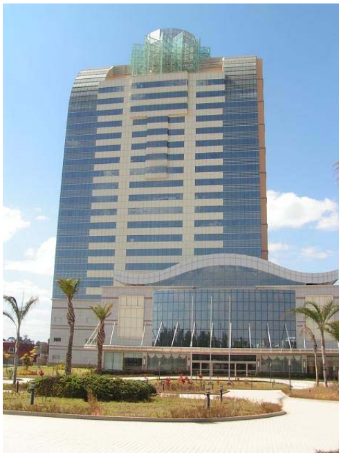
photo 2. L'hôtel voisin jamais achevé. « L'éléphant blanc » d'Antananarivo. Catherine Fournet-Guerin, 2011

A ces constructions impulsées par l'Etat, il est possible d'ajouter d'autres dynamiques spatiales qui confortent le développement de ce pôle : l'ambassade des Etats-Unis, après avoir été localisée depuis 1960 dans le centre-ville d'Antananarivo, a ouvert en 2011 en périphérie, sur la route d'Ivato, à quelque dix kilomètres du centre. D'autres installations aux alentours d'Ivato vont dans le sens d'un développement d'une nouvelle centralité, telles l'une des quatre écoles françaises de la ville, l'école américaine, un grand