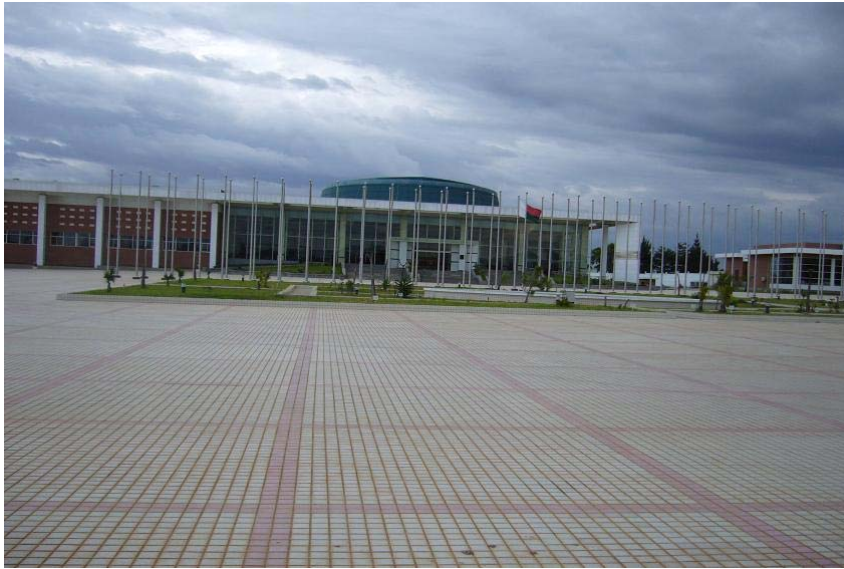
photo 1. Le CCI construit pour le sommet de l'Union africaine en 2009. Catherine Fournet-Guerin, 2011

le grand hôtel joutant le CCI, une tour élancée, est quant à lui resté fermé en raison de son inachèvement. Il fait figure d'éléphant blanc du sommet annulé de l'UA (photo 2).