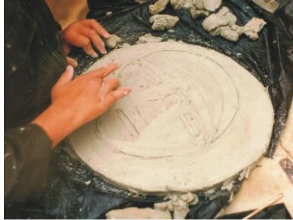
FIGURA PRECOLOMBINA 1