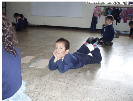
Foto 7. Este alumno está bravo porque se le llamó la atención, porque no quería compartir los rompecabezas