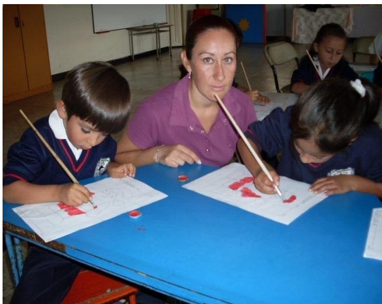
Foto 35. Los niños y niñas están aplicando tempera a Santa Claus