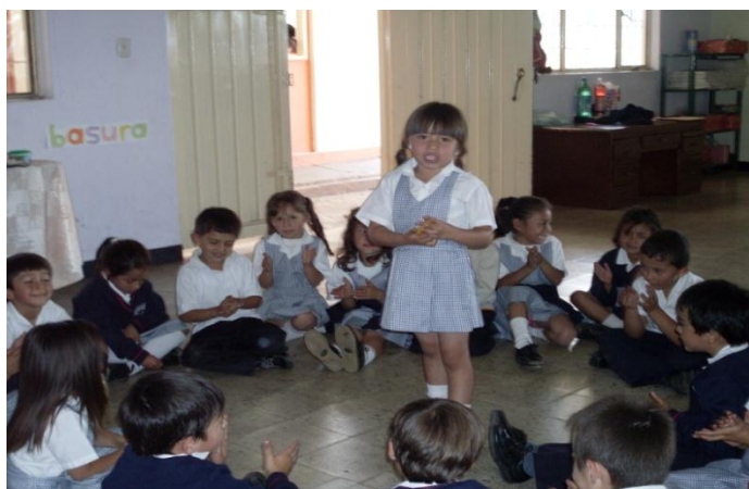
Foto 20. La niña representando a paranagua, los compañeros la acompañaban con las palmas