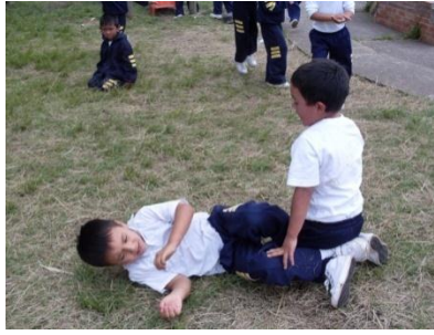
Foto 15. Aquí un niño le pegó a un compañero de otro curso