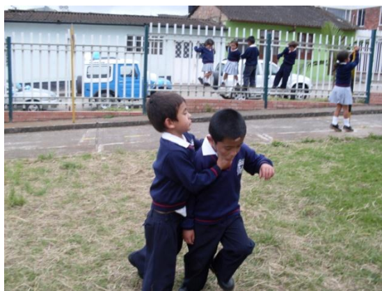
Foto 5. Aquí observamos como un niño está agrediendo a otro en la hora de descanso