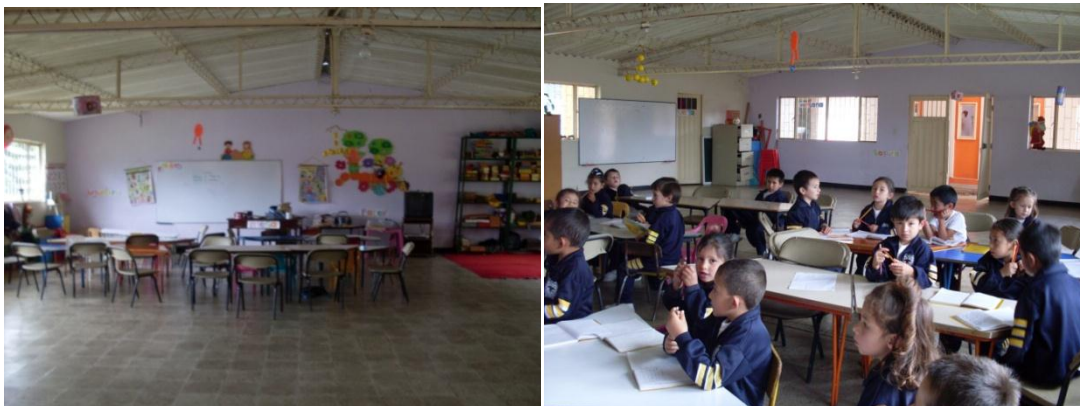
Foto 4. Salón de Preescolar donde se está realizando la Investigación