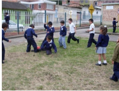
Un alumno hace zancadilla a sus compañeros para que no cojan el balón