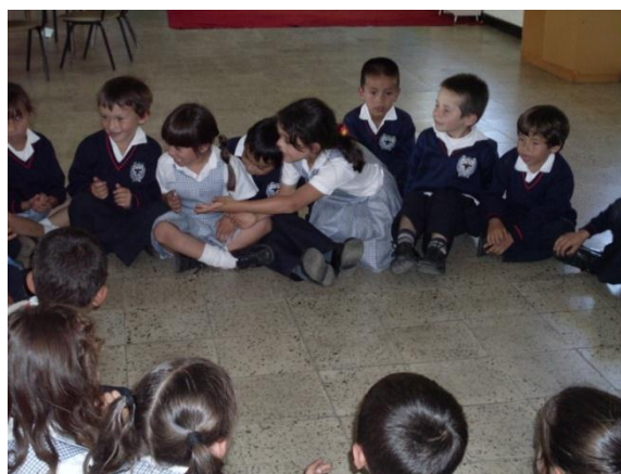
Foto 21. Cantando la canción del Negro Cirilo