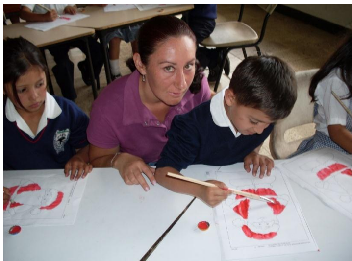
Foto 36. Este niño le está aplicando tempera roja a Santa Claus