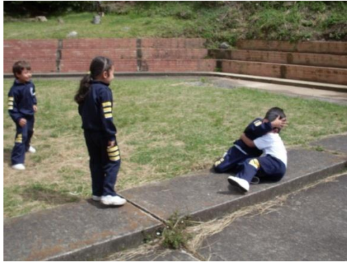
Foto 12. Dos alumnos está peleando en el piso y sus compañeros los observan