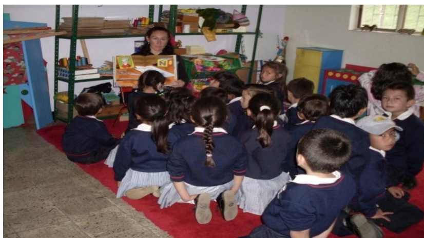
Foto 34. Todo los niños y niñas están concentrados en la lectura del cuento