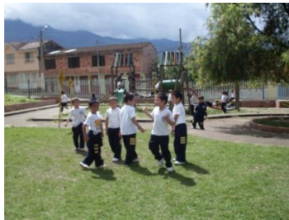
Foto 17. Un niño discute con un compañero porque no lo deja jugar