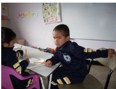
Foto 10. Este alumno está muy bravo porque se le llamó la atención porque le hizo zancadilla a una niña que iba pasando.

Foto 9. Aquí este niño no quiere realizar la actividad, porque se le llamó la atención por mojar a su compañero en el baño