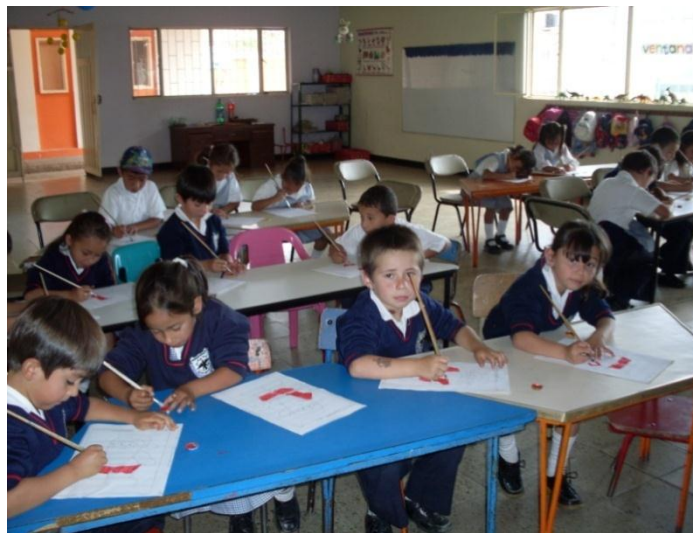
Foto 38. Todos los alumnos están concentrados realizando la actividad