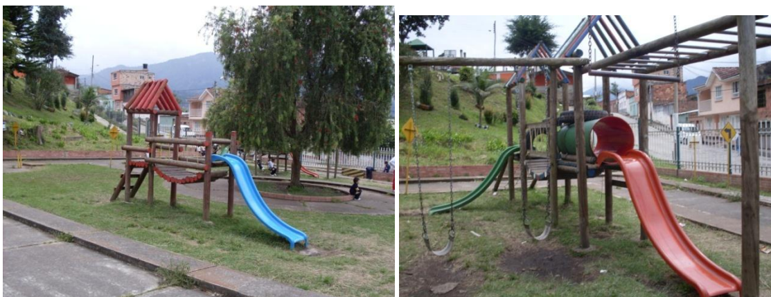
Foto 4. Parque Infantil de recreación de los niños y niñas del Jardín Infantil El Paraíso De los Niños