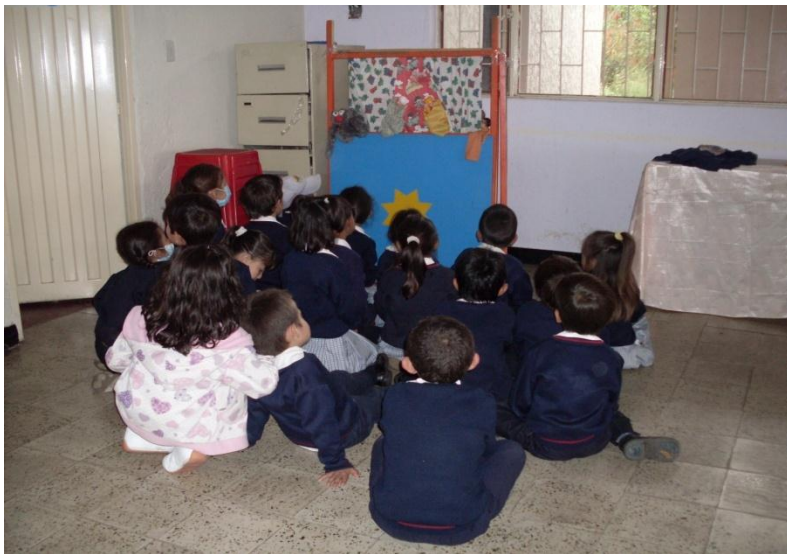
Foto 32. Están observando los personajes de la obra de títeres