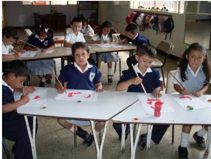
Foto 37. Todos los niños y niñas están muy contentos con la actividad