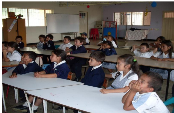
Foto 30. Los alumnos siguen concentrados observando la película