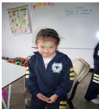
Foto 11. Está niña está triste porque un compañero le hizo golpear los dedos la mesa

Foto 10. Este alumno está muy bravo porque se le llamó la atención porque le hizo zancadilla a una niña que iba pasando.