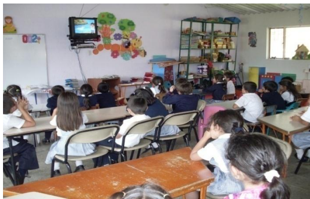
Foto 27. Todos los alumnos estaban muy atentos observando la película