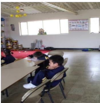
Foto 9. Aquí este niño no quiere realizar la actividad, porque se le llamó la atención por mojar a su compañero en el baño

Foto 8. Aquí todos quieren montar en el columpio pero un niño no los deja, y otro compañero está teniendo el columpio para que no se siga columpiando