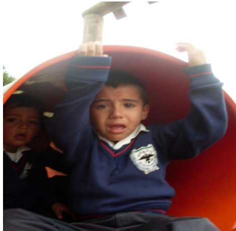
Foto 6. Este niño está llorando porque un compañero le pego