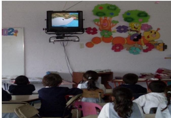
Foto 28. Los alumnos están escuchando lo que les está diciendo el delfín