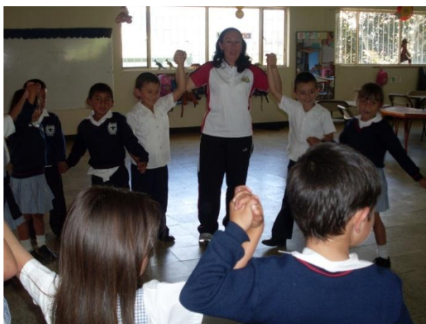
Foto 24. Ronda Cabrito sal de mi huerta