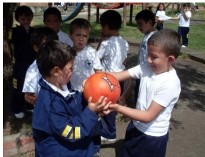
Foto 14. Estos niños están discutiendo por un balón