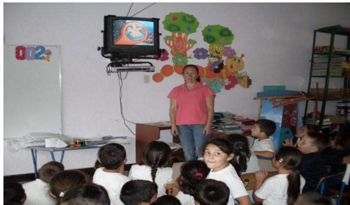
Foto 29. Los niños siguen observando la película