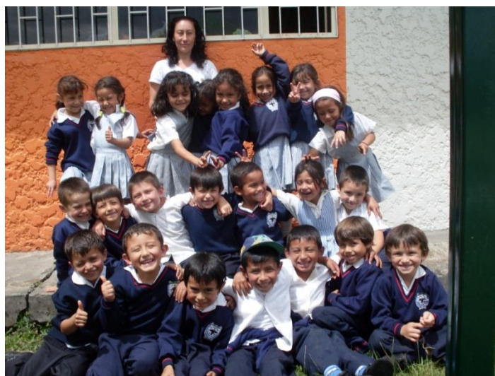
Foto 40. Niños y niñas del Jardín Infantil El Paraíso De Los Niños donde se realizó la investigación