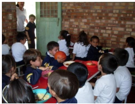
Foto 16. Un alumno está molestando con un balón y no deja comer a sus compañeros