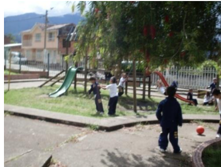
Foto 18. Un niño está cogiendo a su compañero para no dejarlo subir a él rodadero