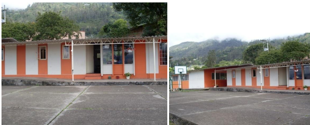
Fotos 1,2 Patio y aulas del Jardín Infantil el Paraíso de los Niños