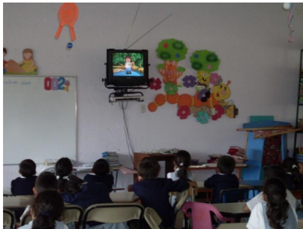
Foto 26. Los niños y niñas estaban observando la película sobre valores