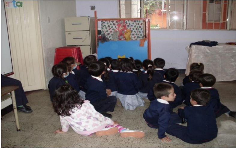
Foto 31. Los niños y niñas observan la obra de títeres “Itzelina y los rayos de sol”