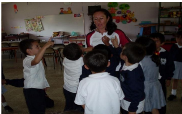
Foto 23. Todos los niños y niñas querían participar en la ronda Cabrito sal de mi huerta