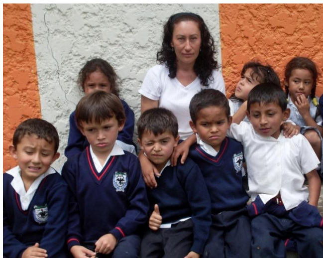
Foto 41. Algunos niños y niñas del Jardín Infantil El Paraíso De Los Niños que presentaban comportamientos de Agressividad