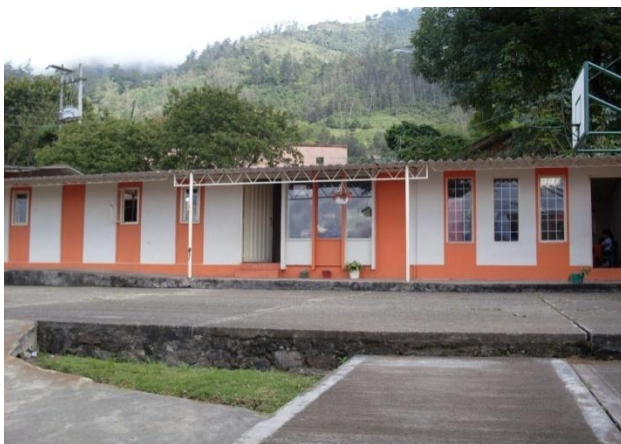
Foto 3. Patio y aulas del Jardín Infantil El Paraíso De Los Niños