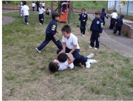
Foto 13. Los niños están peleando en el piso