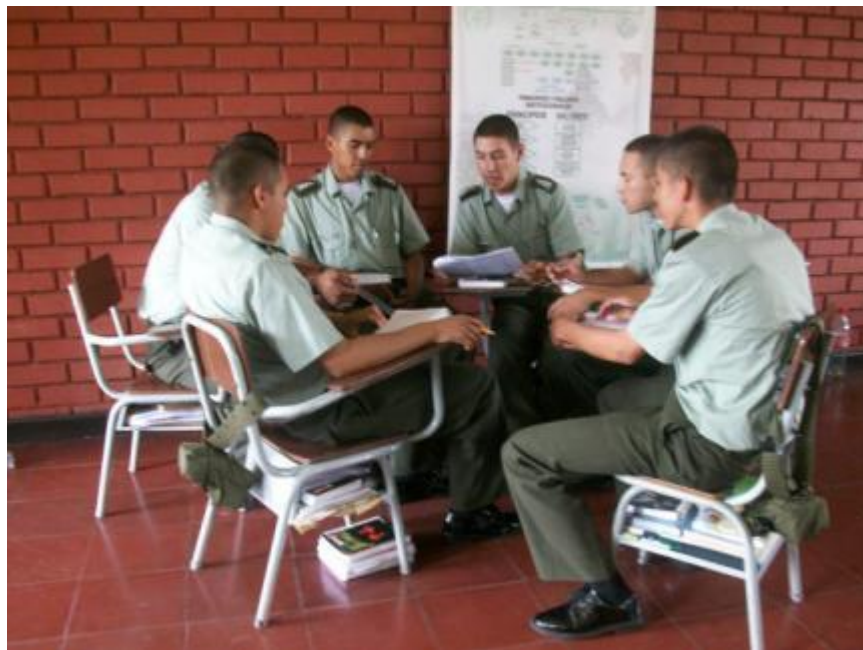
Personal de estudiantes distribuidos en grupos de trabajo para la lectura y análisis de los estudios de casos