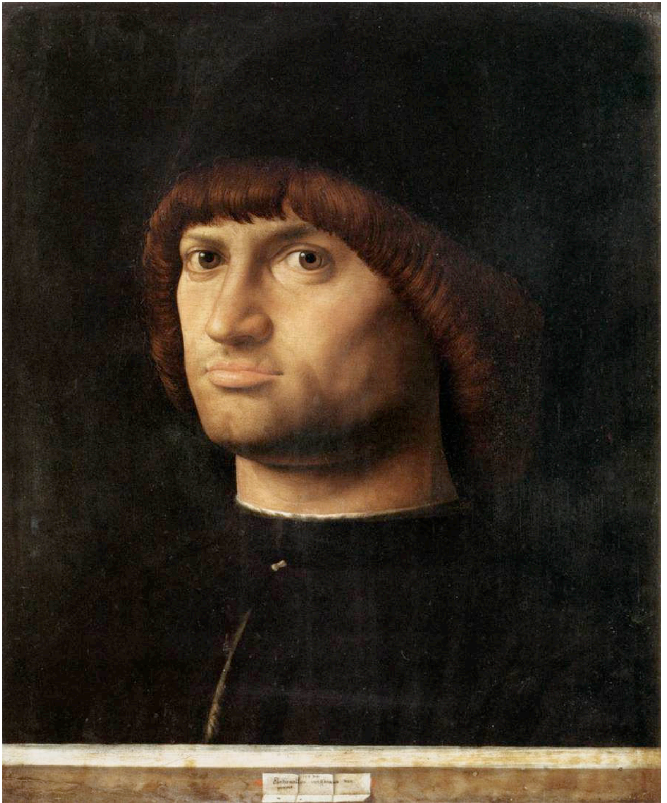
Le Condottière – 1475 - Antonello de Messine

Peinture à l'huile sur bois – 36 cm x 30 cm – Musée du Louvre Paris