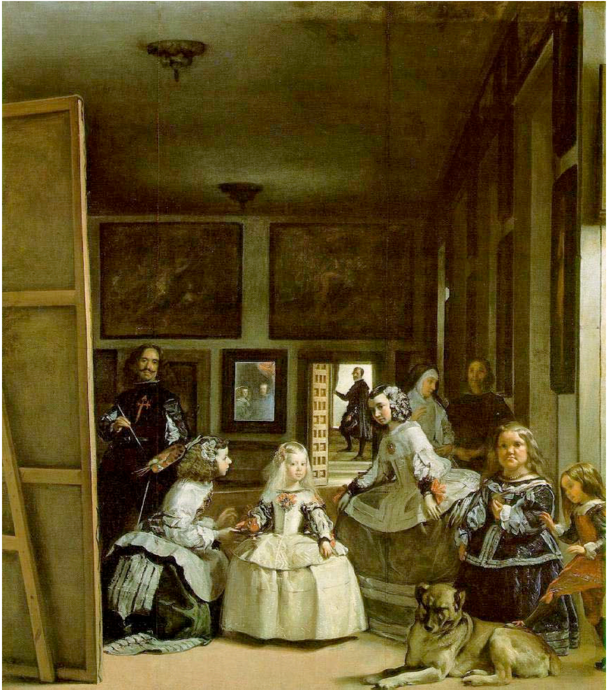
Les Ménines – 1656 – Diego Vélasquez

Huile sur toile – 318 cm x 276 cm – Musée du Prado Madrid