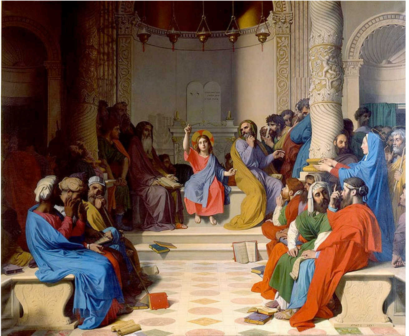
Jésus au milieu des docteurs – 1842/1862 – Jean Auguste Dominique Ingres

Huile sur bois – 265 cm x 320 cm – Musée Ingres Montauban