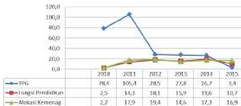
Gambar 2. Grafik Perkembangan Pertumbuhan Alokasi TPG, Fungsi Pendidikan, dan Anggaran Kemenag 2010-2015 (%)

Lebih lanjut, kajian tentang peran kebijakan sertifikasi guru dalam peningkatan mutu pendidikan diuraikan sebagai berikut: