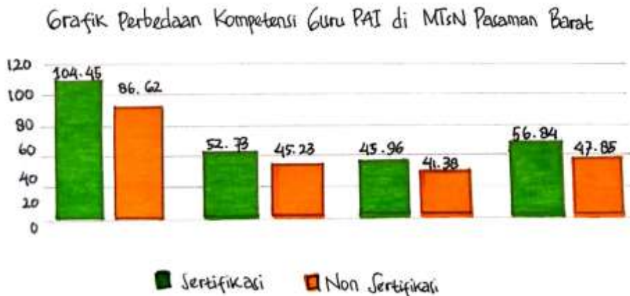
Gambar 3. Grafik Perbedaan Kompetensi Guru PAI di MTsN Pasaman Barat Tahun 2015.

Kebijakan sertifikasi guru memberikan peran penting terhadap upaya nyata pemerintah mewujudkan pendidikan bermutu di Indonesia. Begitupun, kebijakan ini memiliki berbagai kelemahan yang mengakibatkan permasalahan umum pasca guru menerima tunjangan gaji sertifikasi. Ironisnya, tingkat profesionalitas guru pasca sertifikasi tidak menunjukkan peningkatan yang signifikan. Seperti halnya berikut grafik perbedaan kompetensi guru di MTsN Pasaman Barat (Lihat Gambar 3).