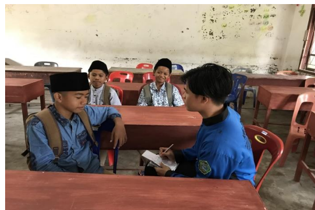
Wawancara dengan siswa kelas VII-1