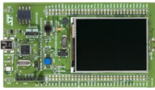
Figura 2: Placa de evaluación STM32F429 Discovery