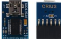
Figura 4: Crius FTDI