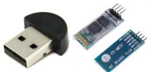
Figura 3: BT-USB (izq.) y módulo HC-06 (der)