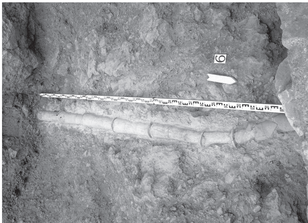
Рис 3. Участок водопровода

Известны фрагменты водопровода, обнаруженные в районе башни № 1 (Барнабо Грилло). Однако по технике изготовления они существенно отличаются от найденных нами изделий. Авторы раскопок датируют их более поздним, османским периодом истории крепости [4, с. 45].