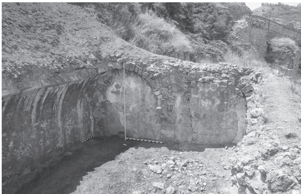
Рис 1. Западная стена башни № 6

Трубы водопровода изготовлены из красного теста местного производства с примесями шамота и извести. Они состоят из тулова и втулки, которые разделены выступающим ободком. Тулово трубы укреплено двумя ребрами жесткости, что указывает на достаточно высокий уровень давления воды в трубах. Толщина стенок изделия уменьшается от раструба к втулке. Подробные размеры фрагментов водопроводной трубы даны в табл. 1.