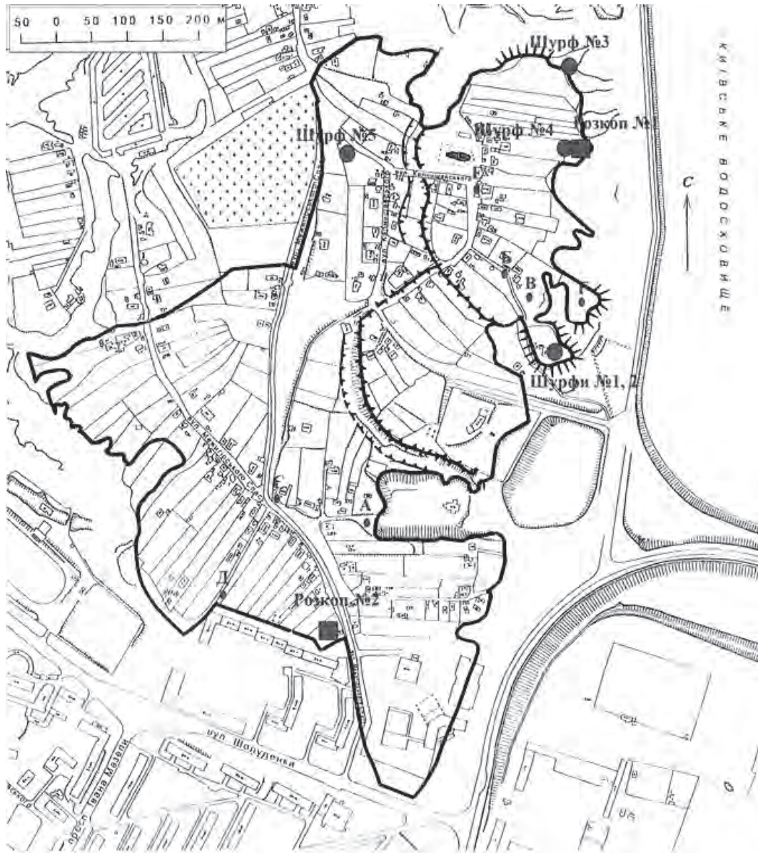
Рис. 1. Загальна схема археологічних робіт на території Вишгородського історико-культурного заповідника у 2012 р.