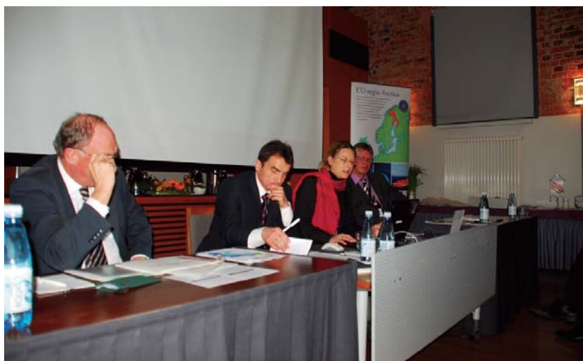
Международный семинар по внешним границам в Оулу, Финляндия, февраль 2010

Здесь следует уяснить, что существует два различных подхода к стратегическому планированию такого взаимного сотрудничества: выделение узловых точек вдоль границы и согласование решений по сотрудничеству для двух планировочных ареалов или выделение одного совместного планировочного ареала и построение единой интегрированной стратегии устойчивого развития трансграничной территории. Этот второй методологический подход положен в основу проекта ULYSSES, реализуемого с участием АЕПР в рамках европейской исследовательской платформы ESPON и в стратегию устойчивого развития еврорегиона «Слобожанщина» в рамках Программы развития трансграничного сотрудничества Харьковской области на 2011 – 2016 годы. Уникальная возможность обмена результатами обоих проектов на платформе АЕПР позволит исполнительному комитету Совета руководителей приграничных областей Республики Беларусь, Российской Федерации и Украины в перспективе распространить данный инновационный подход на остальные российско-украинские еврорегионы — «Днепр»,