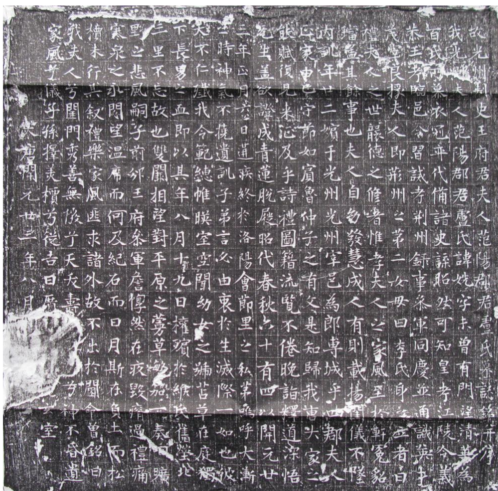
大唐开元 23 年光州刺史王府君夫人墓志铭

1949年1月31日潢川解放，设潢川专区，辖潢川、光山、固始、商城、息县、淮滨、新县七县。1952年，潢川及其辖县并入信阳地区。