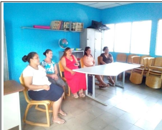
Madres participantes de los grupos focales