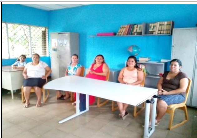
Madres participando en el grupo focal