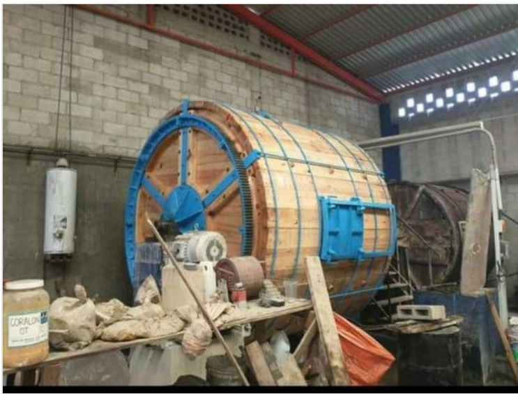
Imagen 3. Planta de cueros Belén SAS