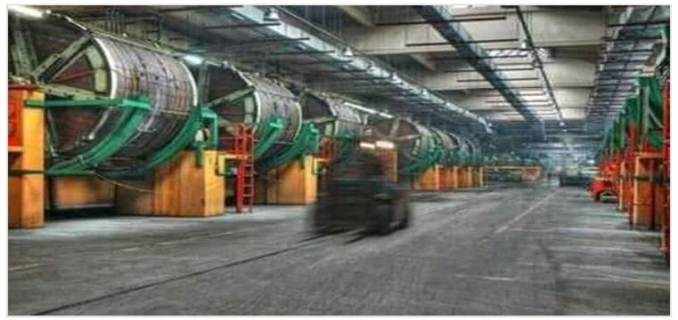
Imagen 4. Proceso de tratamiento de pieles