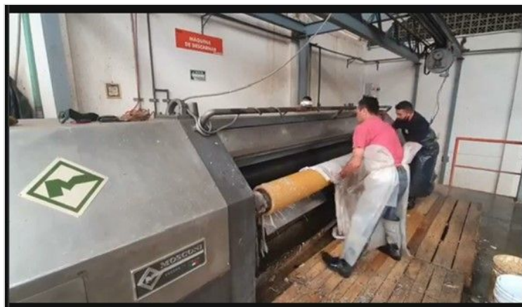
Imagen 2. Tambor del proceso de calado en cueros Belén SAS