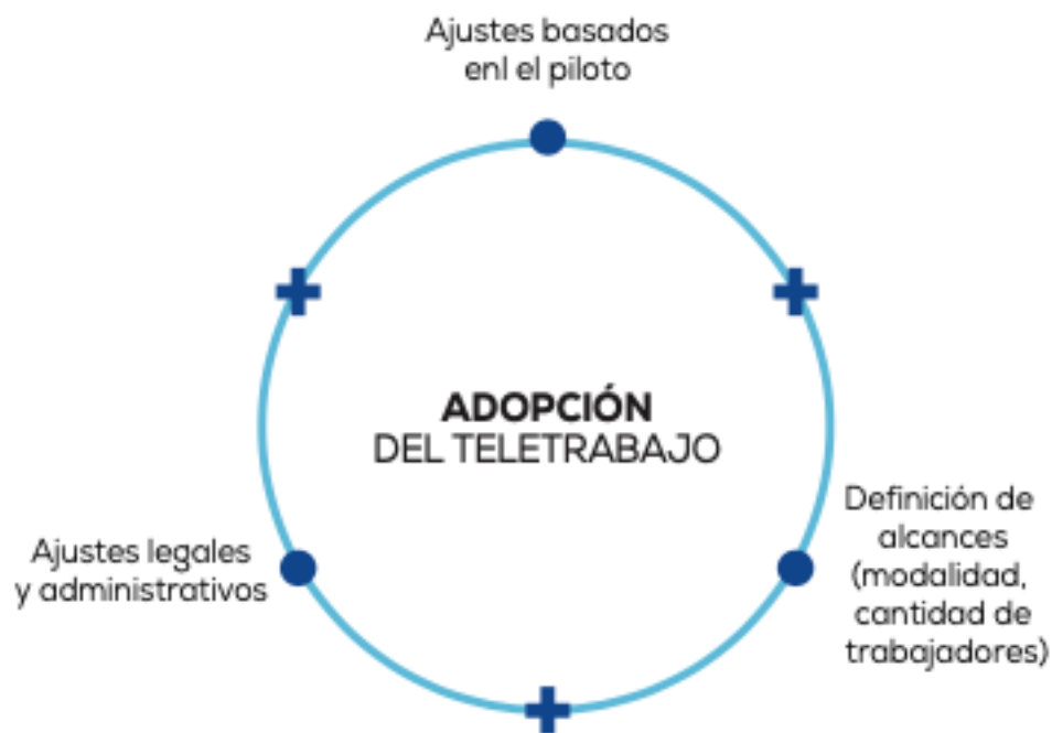
Figura 4. Adopción de la modalidad de Teletrabajo. Tomado de (MinTIC, 2018, p. 32).