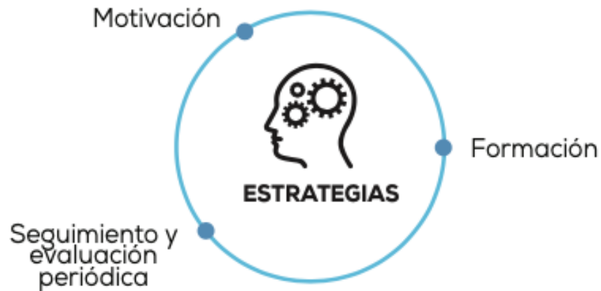
Figura 5. Estrategias de comunicación y seguimiento del Teletrabajo. Tomado de (MinTIC, 2018, p. 33)

según las metas esperadas y justificando la existencia del proyecto, dicha sostenibilidad se basa en integrar la formación, motivación y el seguimiento y evaluación periódica del proceso del Teletrabajo que ha implementado la compañía, como lo muestra la Figura 5: