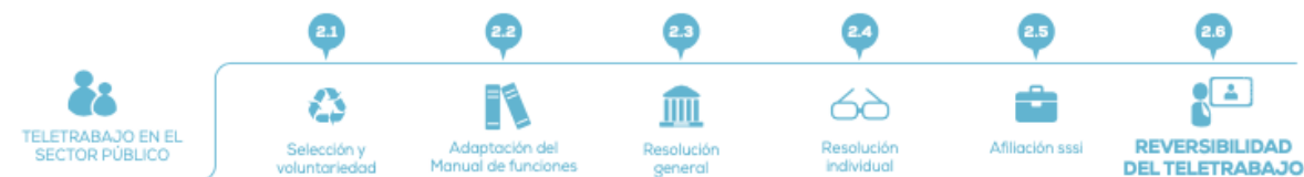
Figura 8. Requisitos de adopción de Teletrabajo en el Público. Tomado de (MinTIC, 2018, p. 64).