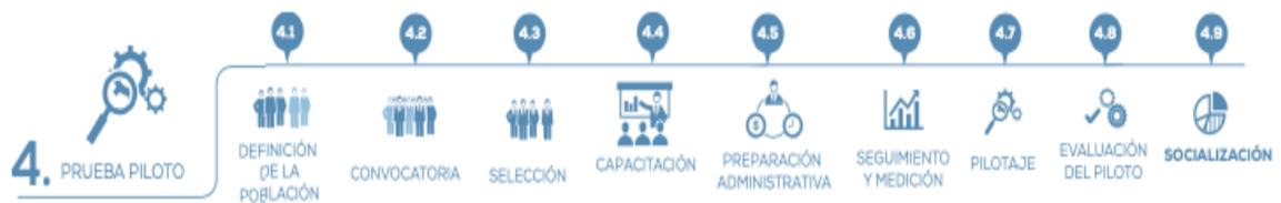
Figura 3. Prueba piloto de Teletrabajo. Tomado de (MinTIC, 2018, p. 30)

5. Apropiación y adopción: cuando se finalice y se tengan los resultados de la prueba piloto, entra en acción la etapa que busca detallar y acomodar el proyecto de forma tal que sea posible una implementación sin contratiempos y duradera en la compañía, para el cual se plantean tres pasos: