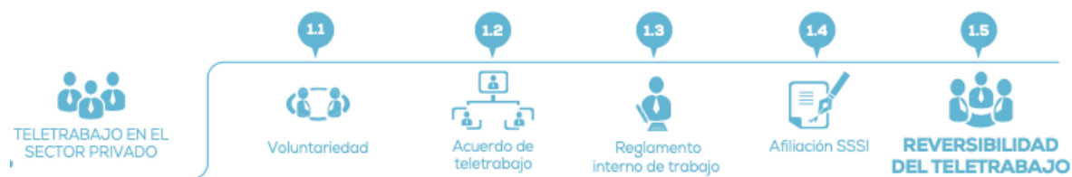
Figura 7. Requisitos de adopción de Teletrabajo en el Sector Privado. Tomado de (MinTIC, 2018, p. 60).