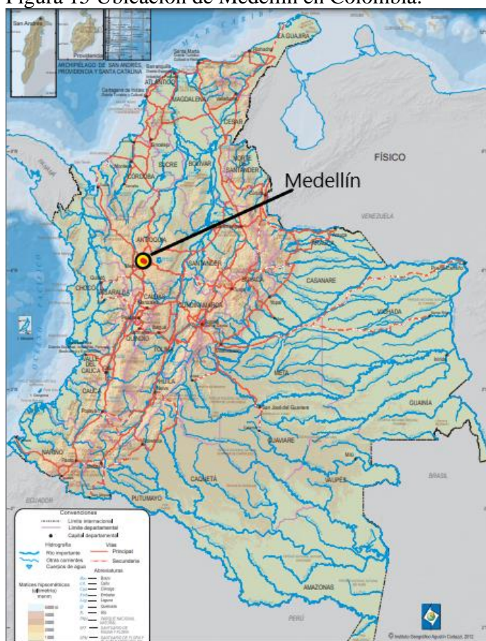
Figura 15 Ubicación de Medellín en Colombia.

Capital del departamento de Antioquia, Medellín es considerada la segunda ciudad más importante del país después de Bogotá, conocida como la ‘Ciudad de la Eterna Primavera’, sus habitantes se caracterizan por hacer parte de una cultura hospitalaria, siempre amable y con un alto sentido de pertenencia por la ciudad, con una temperatura entre los 16°C y 26°C, y ubicada a 1495msnm, es uno de los principales centros de producción de la nación, es sede de importantes empresas de orden nacional y también multinacionales, en sectores como: textil, confecciones, metalmeccánico, salud, telecomunicaciones, energético, financiero, construcción, automotriz y alimentos, entre otros. (Colombia Travel, s.f.) (Medellin Travel, s.f.).