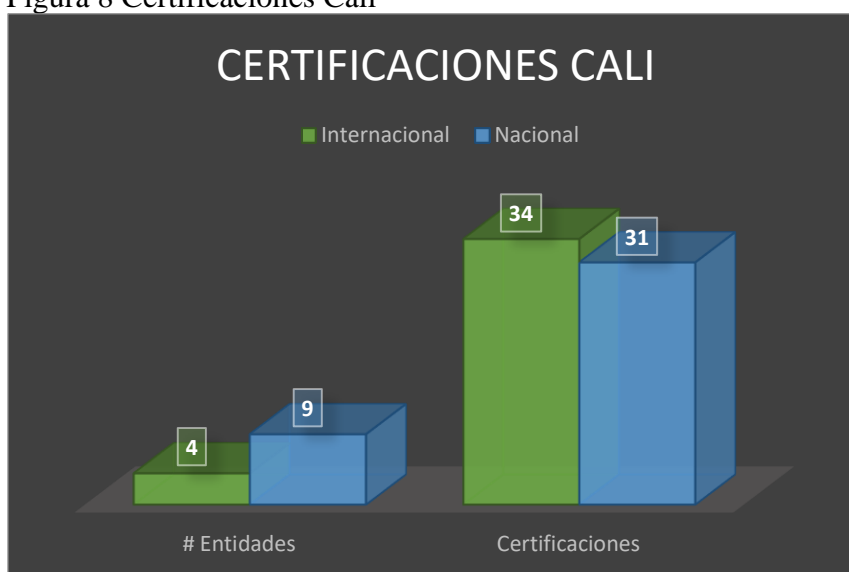
Figura 8 Certificaciones Cali