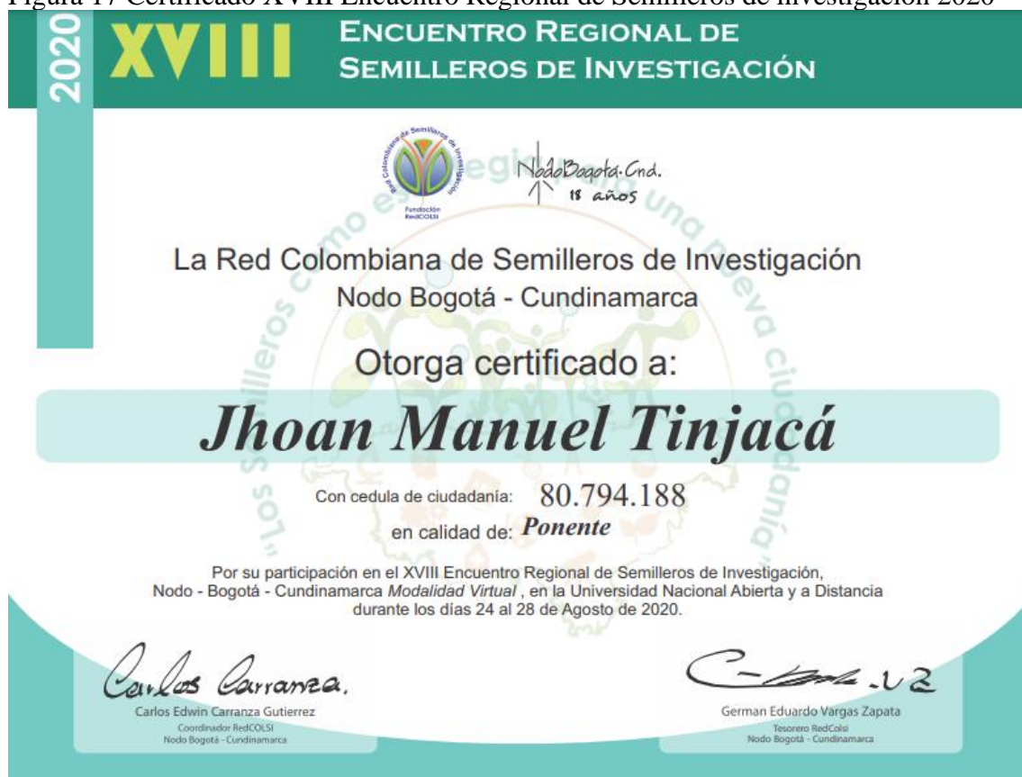
Figura 17 Certificado XVIII Encuentro Regional de Semilleros de investigación 2020