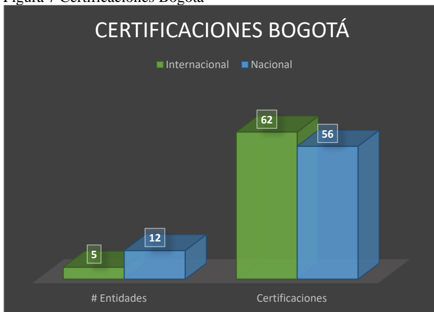
Figura 7 Certificaciones Bogotá