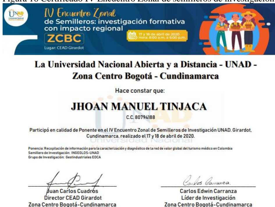
Figura 16 Certificado IV Encuentro Zonal de semilleros de investigación 2020