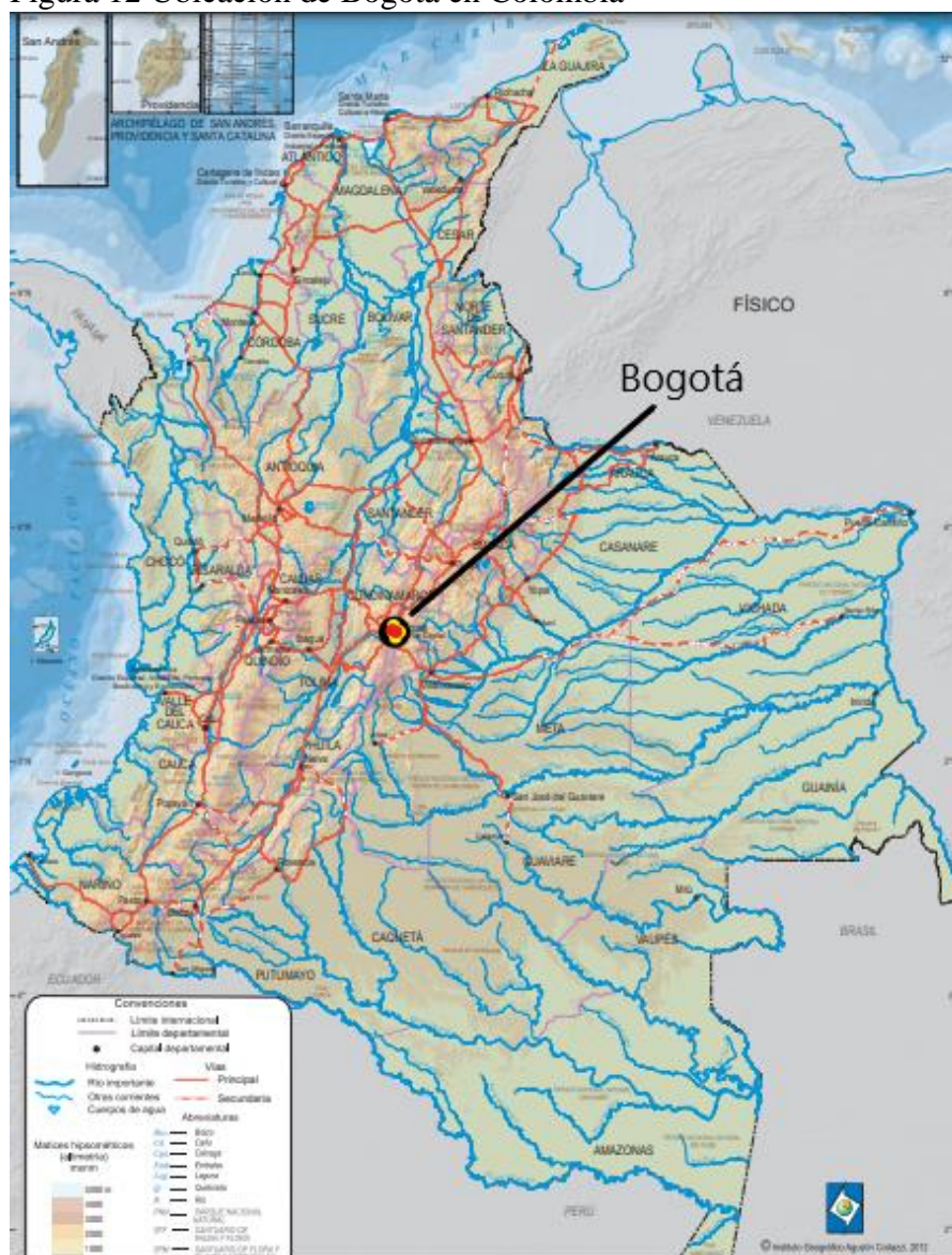
Figura 12 Ubicación de Bogotá en Colombia

Bogotá es el epicentro turístico, cultural, económico y administrativo de Colombia. Sus calles son un legado de tradición, recuerdos y emociones en donde convergen la multiculturalidad y la diversidad. Se caracteriza por tener un clima moderadamente frío con cerca de 14°C promedio. Se encuentra a un promedio de 2.625 metros sobre el nivel del mar. Está ubicada en el centro de Colombia, en la región natural sabana de Bogotá, que forma parte del altiplano cundiboyacense, ubicada en la cordillera Oriental de los Andes. (Alcaldía Mayor de Bogotá, s.f.)