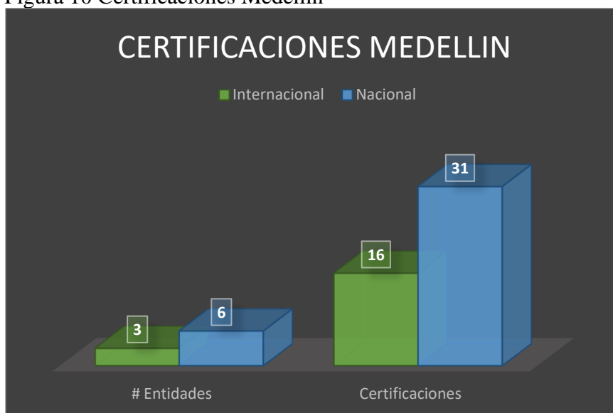
Figura 10 Certificaciones Medellín