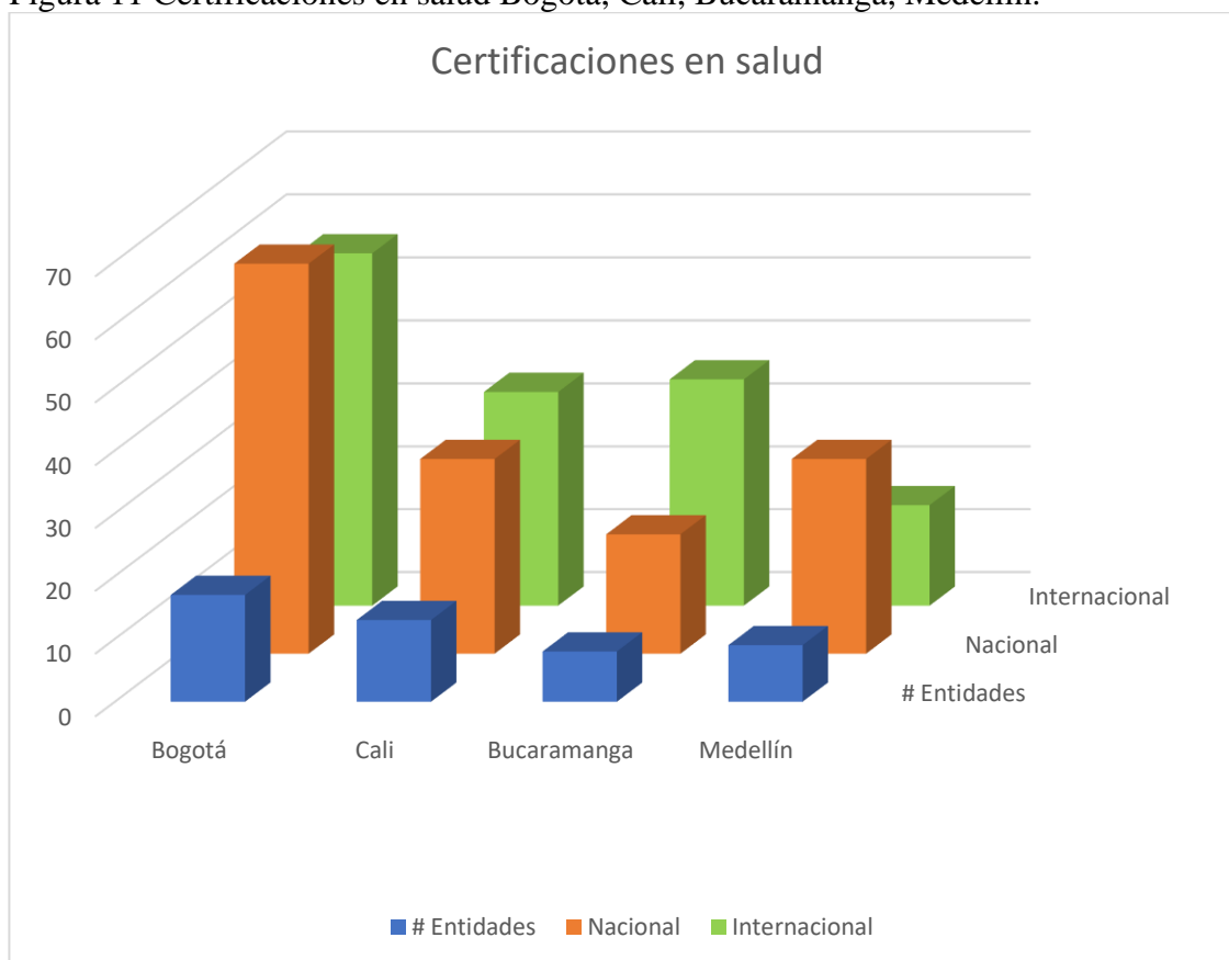
Figura 11 Certificaciones en salud Bogotá, Cali, Bucaramanga, Medellín.