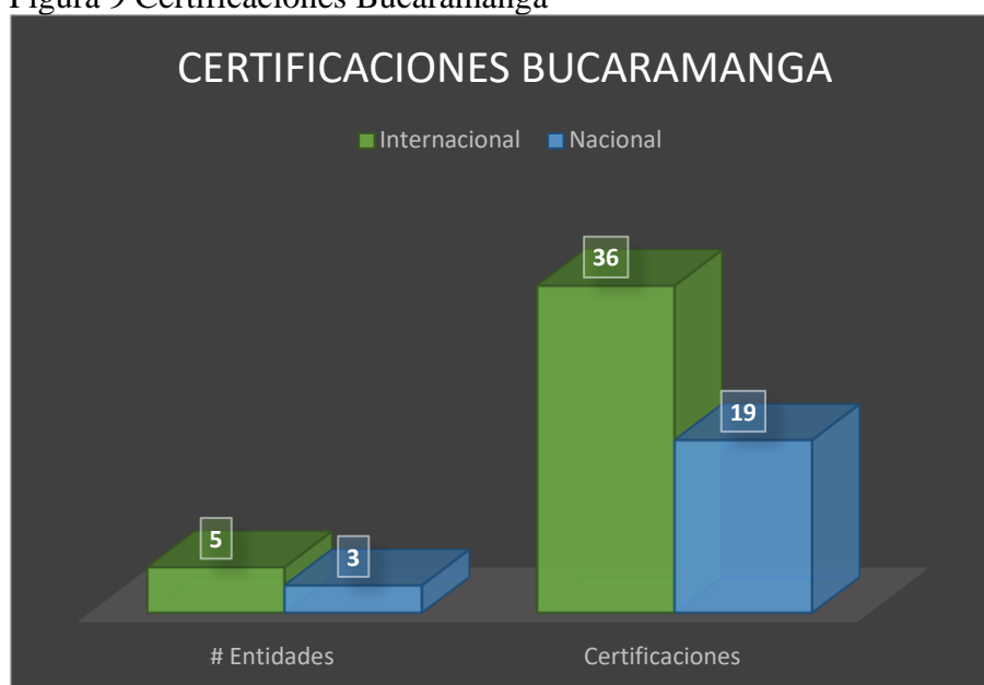
Figura 9 Certificaciones Bucaramanga