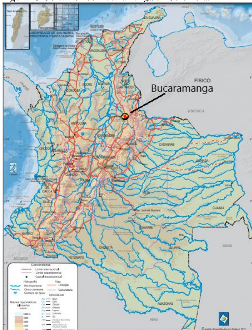
Figura 13 Ubicación de Bucaramanga en Colombia.

Capital de departamento de Santander, al nororiente de Colombia, ubicada a 916 metros sobre el nivel del mar aproximadamente, con climas variados entre cálido y frío, con 25 grados centígrados de temperatura en promedio. Conocida como la `Ciudad de los Parques` o `la ciudad bonita`, Bucaramanga, junto con Floridablanca, Girón y Piedecuesta conforman el Área Metropolitana de Bucaramanga, se caracteriza por su sólida oferta hotelera, con una gran actividad comercial e industrial que la convierte en un excelente destino de negocios en Colombia. (Colombia Travel, s.f.) (UPB, s.f.)