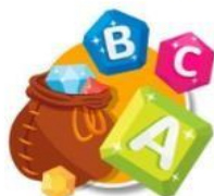
Abecedario en inglés

Bienvenidos a nuestra área de inglés para niños. En un mundo conectado por la tecnología, aprender inglés provee a los niños un futuro con oportunidades profesionales y sociales más amplias y una visión más profunda del mundo. Al hablar español podemos comunicarnos con aproximadamente 437 millones de personas, pero el inglés nos permite comunicarnos con 1.5 billones de personas. En Árbol ABC te invitamos a compartir nuestros juegos de inglés para niños con tus hijos o alumnos. ¡Aprender inglés será muy divertido!