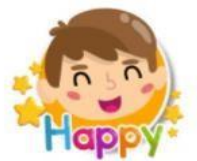
Vocabulario en inglés