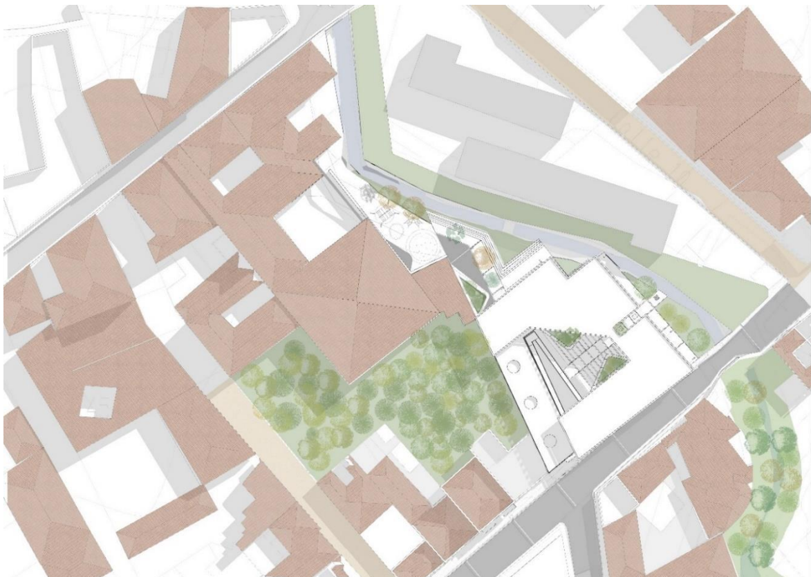
Figura 3. Elaboración propia, 2020.