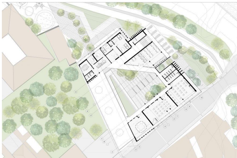
Figura 5. Elaboración propia, 2020

La cubierta de primer nivel tiene perforaciones para mejorar la iluminación cenital, esta misma se dispone como cubierta transitable, se conecta con el segundo nivel y con la rampa