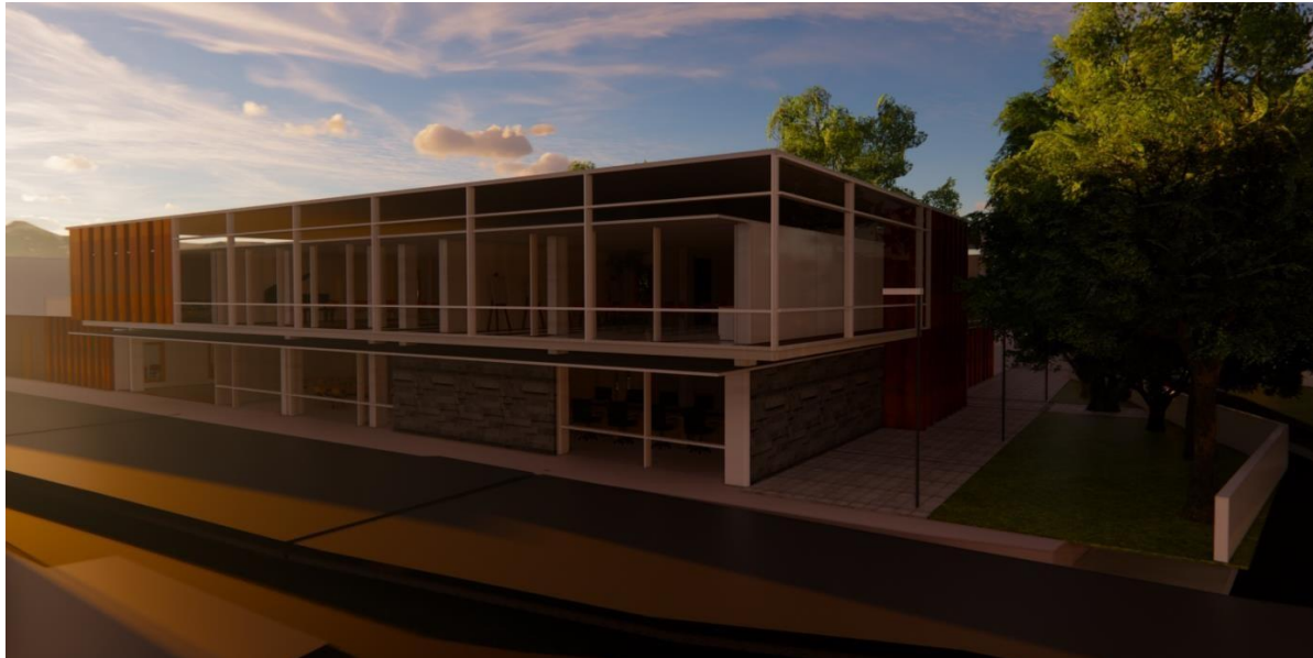
Figura 6. Elaboración propia, 2020