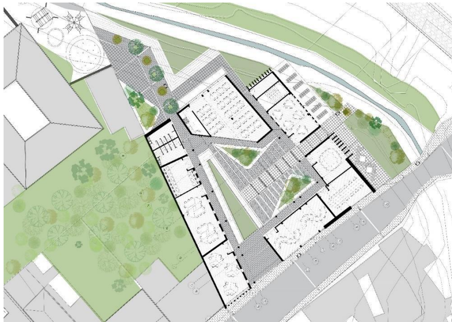
Figura 4. Elaboración propia, 2020.

La vegetación principal que será incluida en estos jardines y en el borde de la quebrada son arboles como el Guayacán de Manzales, el Timboco, Sauce Colorado, Arrayán y Sauco Rojo, los cuales son nativos del municipio, y principalmente los tengo en cuenta por sus flores y colores llamativos.