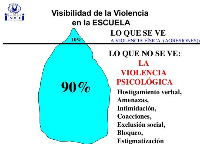
Figura 1. Visibilidad de la violencia en la escuela. Iñaki Piñuel.

Fuente: Estudio Cisneros X “Violencia y acoso escolar en España”. Septiembre 2006.