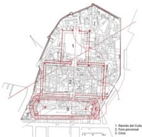
Planta del conjunto según R. Cortés y R. Gabriel

La Parte Alta de Tarragona es un palimpsesto donde la ciudad actual se superpone a la parte monumental de Tarraco, en tres terrazas sucesivas ocupadas de abajo a arriba por el Circo romano, el Foro provincial y la zona del Culto. El arte del buen establecimiento romano se concretaba en un proyecto que resolvía con brillantez la articulación de los distintos niveles y el encaje de las tres grandes piezas urbanas. Siendo así, uno de los principales atributos de su implantación radica en la buena relación de los elementos, subrayada en algún punto por la aparición de elementos de arquitectura singular como el Pretorio y la Torre de la Antigua Audiencia que permitían conectar el nivel del Circo con el del Foro provincial.