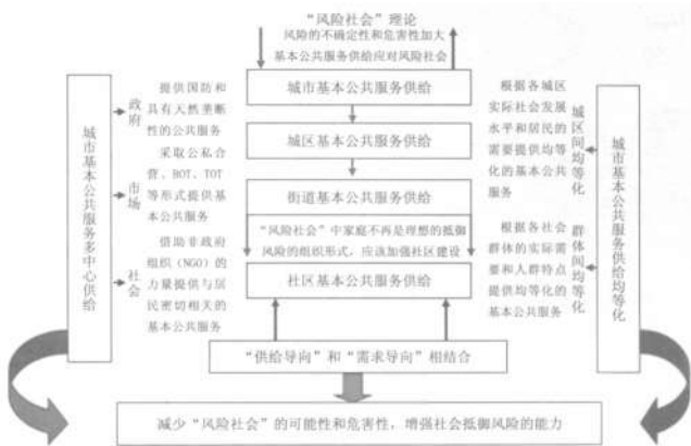
图3 “风险社会”理论视角下城市基本公共服务供给机制

重新构建城市基本公共服务供给机制的过程中,必须充分认识到公共服务管理的复杂性,复杂性不仅要求公共服务供给具有多方参与,而且意味着参与者需要寻求两种形式:一是参与者的互动,二是,在代表性事件中,有高素质的参与队伍。 [6] 这就说明,城市基本公共服务机制的重新构建,并不只是公共服务供给内容和供给方式的改变,而是要求城市基本公共服务供给机制能够兼顾各方,灵活应对不确定世界中的风险和公共服务供给计划的刚性。