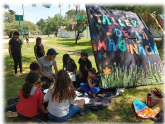
Figura N°3 y N° 4: En la plaza del barrio

Entendemos que ampliar y fortalecer las trayectorias escolares y educativas de las/os niñas/os que requieren mayor apoyo pedagógico y acompañamiento para acceder y/o sostener su escolaridad plena, supone cumplimentar plenamente el derecho a la educación, en los términos que plantea la Ley N° 26.206, Ley de Educación Nacional. En este sentido, la educación es concebida como un derecho, un bien público y social del cual las instituciones y la sociedad son corresponsables en su cumplimiento. En esta clave, resulta fundamental considerar las condiciones específicas de las infancias en ese territorio para habilitar espacios y situaciones que acompañen las trayectorias educativas de las/os niñas/os desde la cual se desarrollen estrategias diferenciadas que atiendan a sus problemáticas y se articulen con las escuelas primarias a las que asisten.